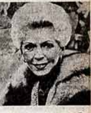
Перед зрителем она предстает в роли героини Ланы Тернер.

Шестидесят два года — не возраст для актрисы, тем более талантливой. Лана Тернер после десятилетнего перерыва решила вновь предстать перед зрителем в роли героини.