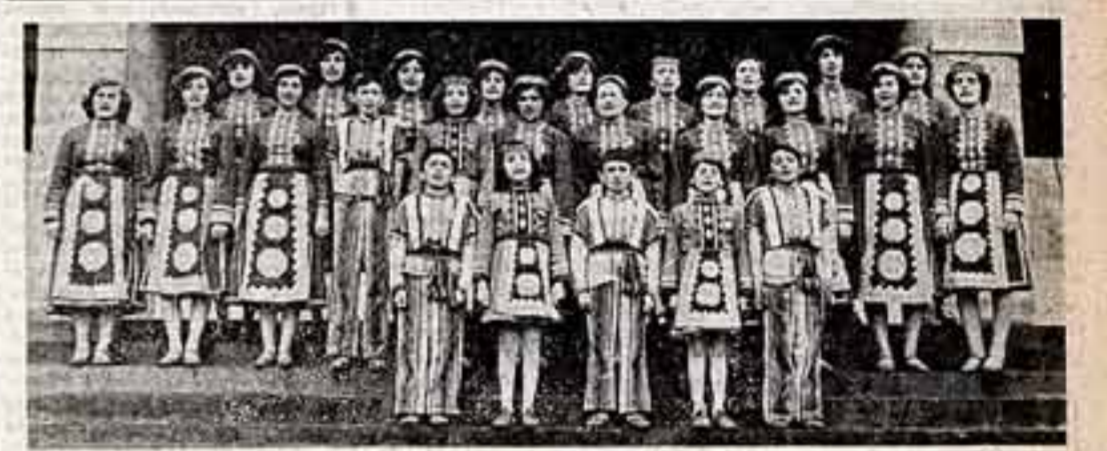
Хор этнографического ансамбля «Цовсар» из села Верин Соснаник.