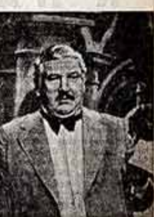
Фильм снят по роману Льюиса Кристи. Питер Устинов играет роль сыщика Пуаро.

Питер Устинов — один из тех немногих западных актеров, чье имя на афише фильма уже гарантирует ему успех у зрителя.