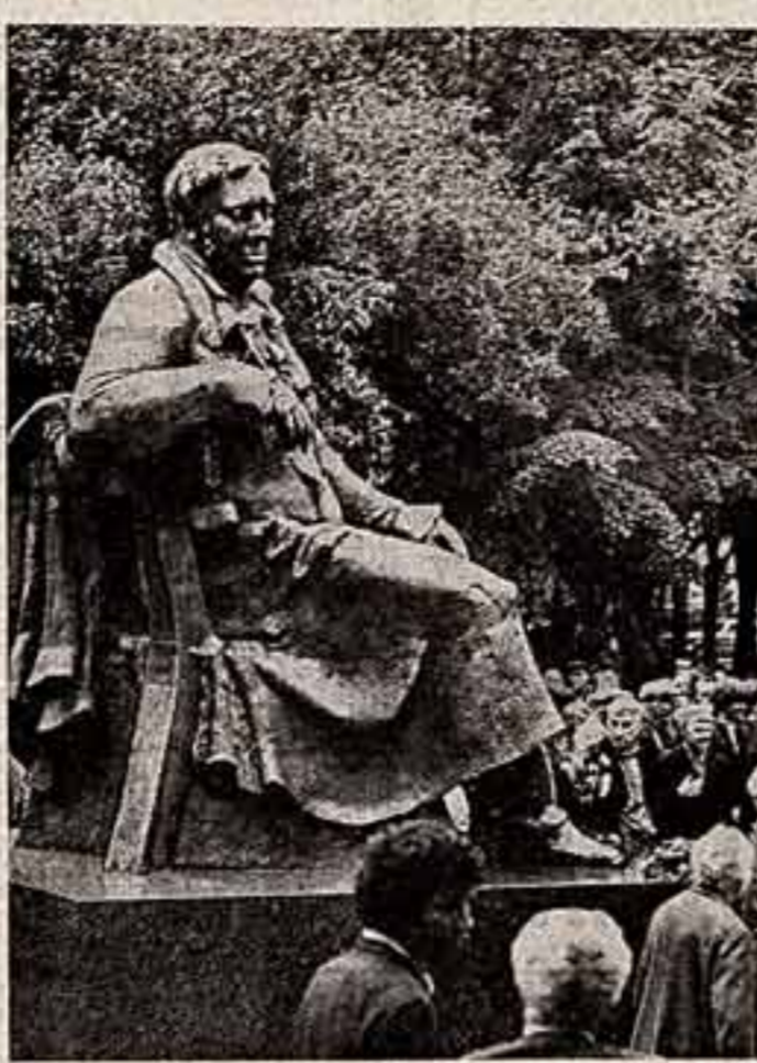
Зачетному русскому баснописцу Ивану Андреевичу Крыкову в Москве открыт памятник. В старом уютном сквере, неподалеку от станции метро «Площадь Революции», в расцвете творческих сил, полный замислов, которым еще суждено воплотиться в новые всенародно известные басни.