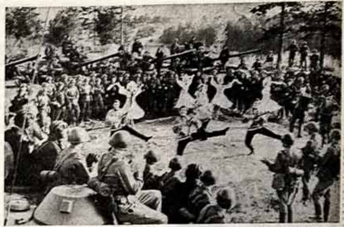
ФОТОКОНКУРС П. ЗИТЛИЦКЕР. «Концерт в лесу у реки»

Знакомство с заводом началось в народном музее Дворца культуры, где я узнала много интересного. Например, что лубочную броню для легендарного крейсера «Потемкин» делали именно здесь.