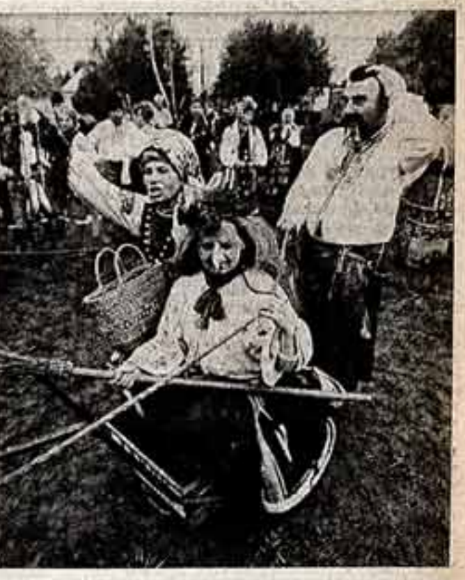
Участники театрализованного представления.