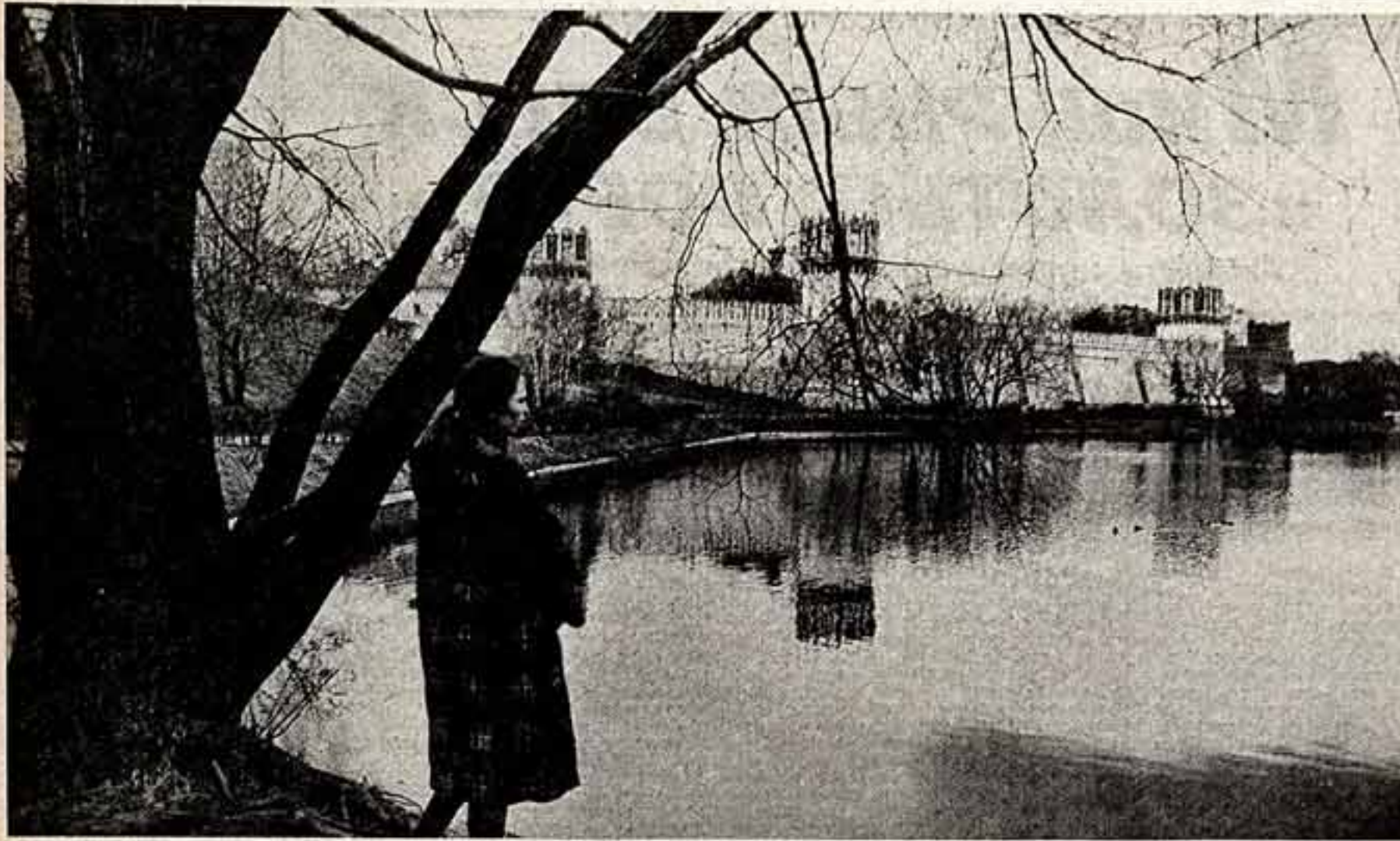
ФОТОКОНКУРС В. ВЕЩИЛКИН. «Осеня пришла в Москву».