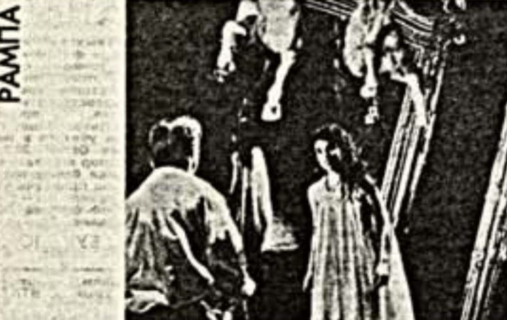
Джонатан Кент в театральном исполнении.