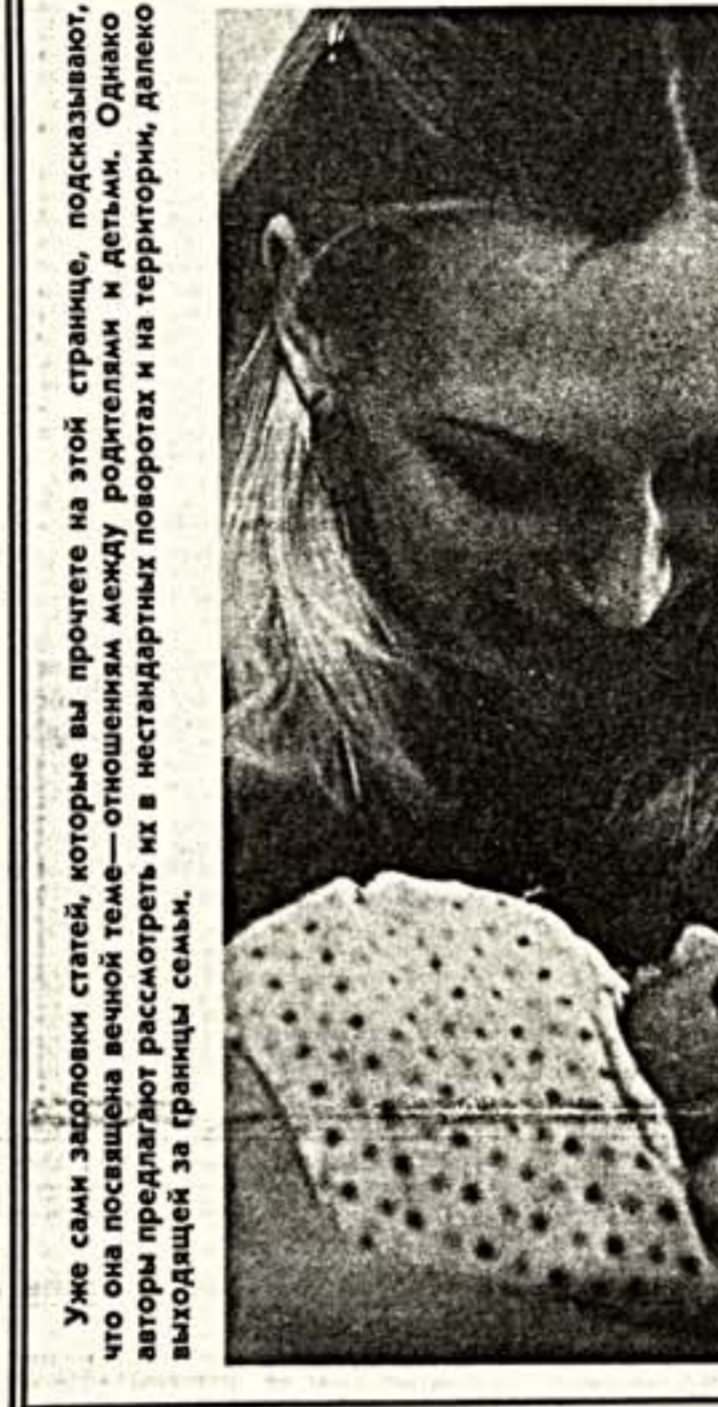
Уже сами заголовки статей, которые вы прочтете на этой странице, подсказывают, что она посвящена вечной теме — отношениям между родителями и детьми. Однако авторы предлагают рассмотреть их в нестандартных поворотах и на территории, далеко выходящей за границы семьи.

сала начальство о безобразиях, которые видел. В ответ мама наяривала сюда, в Карлаг. Когда я увидел за колонией проволочной сетью восемь тысяч молодых женщин, некоторые — с грудными детьми, то понял: что-то творится не то. Среди заключенных было много энергичных, интеллигентных, они и тут себя проявили. Фабрику построили сами, работая клуб, кружки.