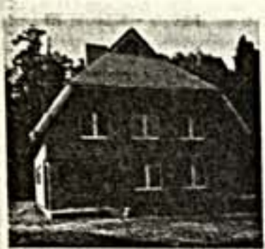
Симпатичный домик, правда! Конечно, он вымирает, будь он сделан хоть как-то по канонам хорошего строительства. И все равно он заслуживает уважения.