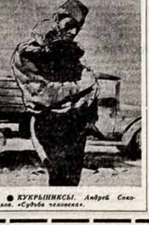
КУКРЫНИНСКИЙ, Андрей Соколов. «Судьба человека».