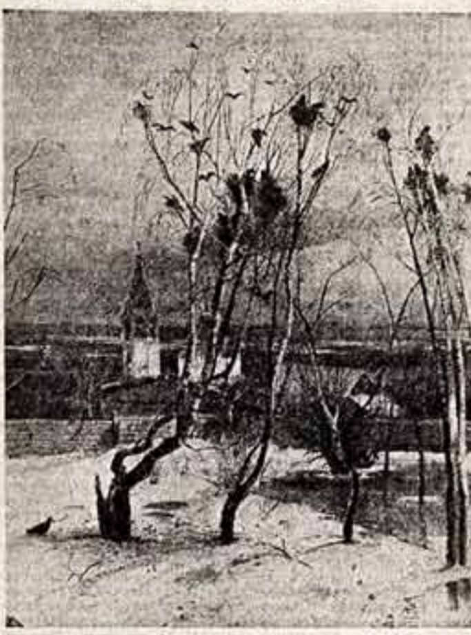
Картина А. К. Саврасова «Восход солнца»