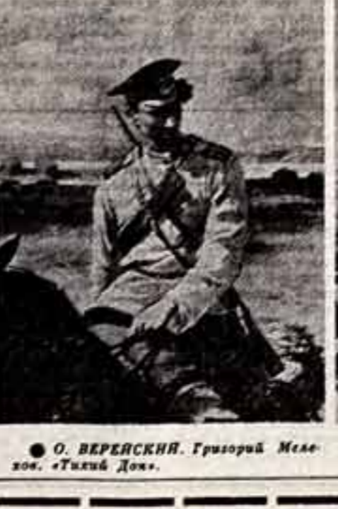
О. ВЕРБИТСКИЙ, Григорий Мелехов. «Тихий Дон».