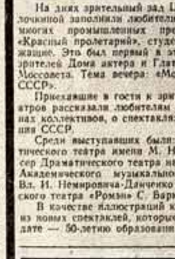
«Солдатская вдова» — так называется спектакль, премьеру которого состоялось в Московском драматическом театре имени М. Н. Ермолова.

Здесь владение актрисы и человеческий талант героини сливаются воедино. Такой способностью к ошущающему художному подъему наделяны все героини Малеванной, актрисы современного трагедийного склада, современной остроты восприятия жизни.