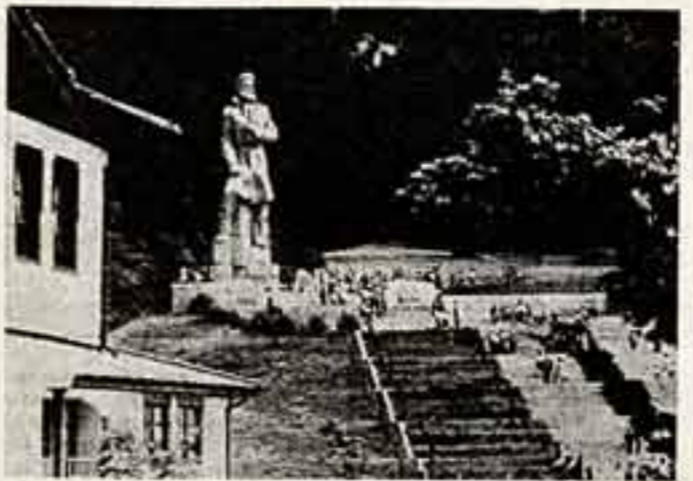
Мемориал, посвященный памяти легендарного болгарского революционера...