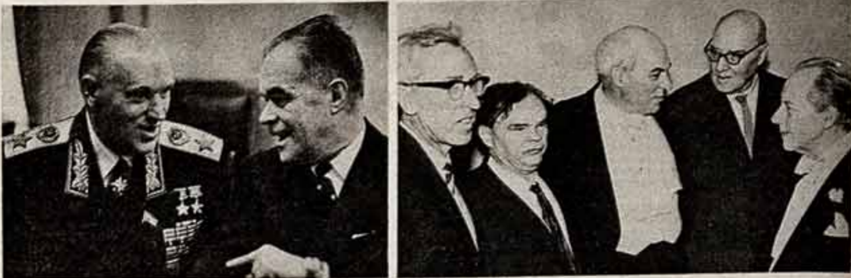
В. МАСТЮКОВ, Маршал Советского Союза Константин Рокоссовский и кинорежиссер Марк Донской (1965 год). И. ГРАНОВ. Советские музыканты Д. Кабалевский, К. Нелков, Ю. Шапорин и их английские коллеги А. Бун, А. Роустон (1963 год).