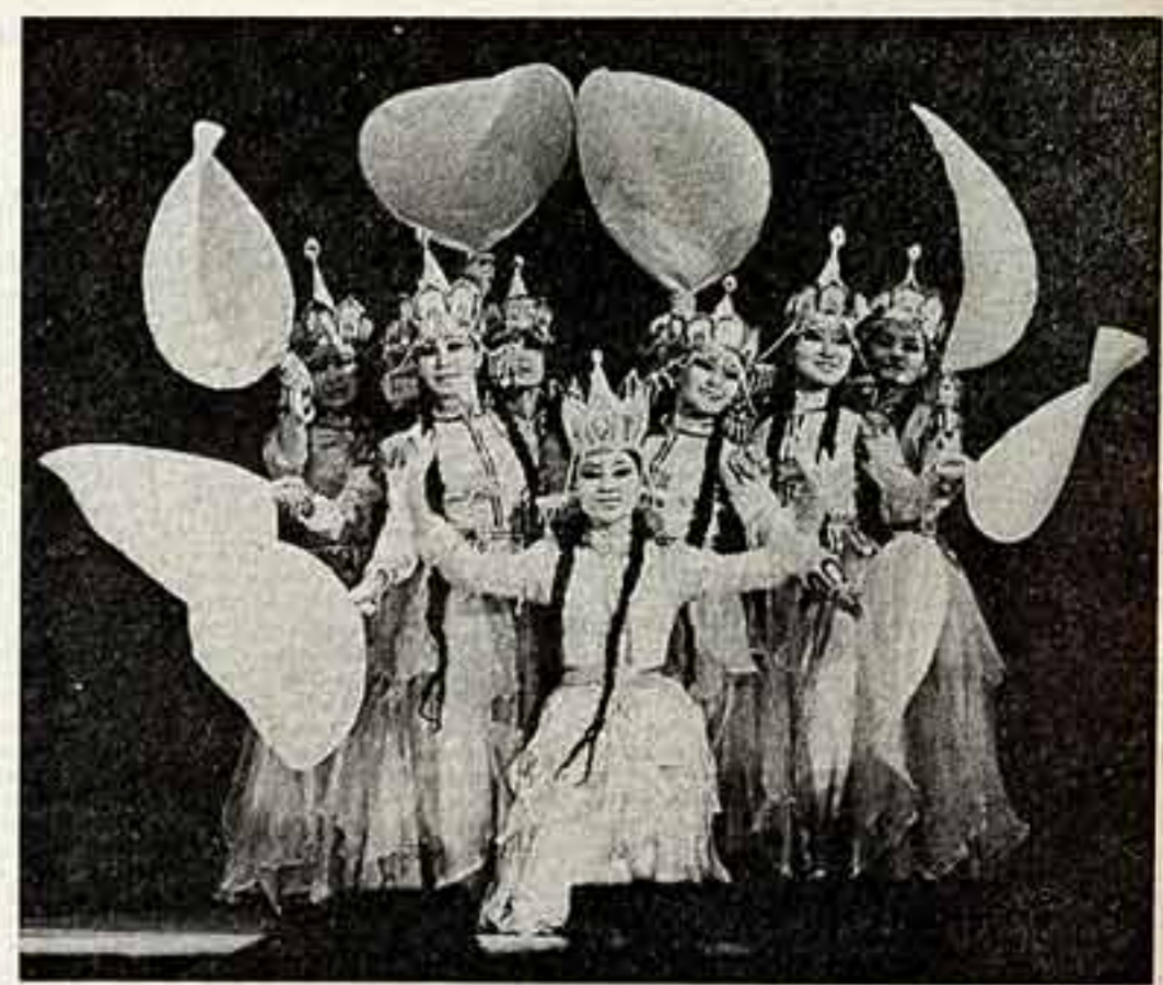
Народный ансамбль восточного танца «Лотос» — один из лучших самодеятельных коллективов Бурятии. Искусство «Лотоса» знают не только в нашей стране, но и за рубежом.

В. САДКОВСКИЙ, наш спец. корреспондент, ПЕТРОПАВЛОВСК-КАМЧАТСКИЙ.