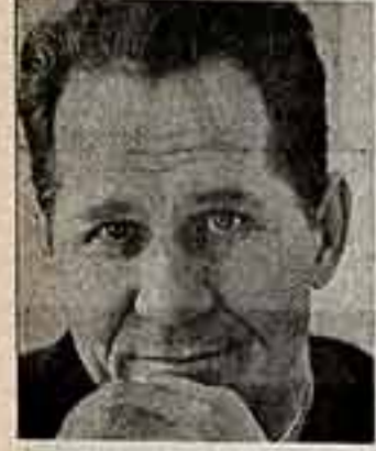
С жалобами на первого секретаря райкома партии в гостище меня уже ждали двое. Затем по телефону «внес ясность» Попов еще один. Оставались меня и на улицах.

Тихая окраина Терновка некогда не давала такого повода. И когда я фотокорра пригласил в поездку, он, невольно знающий область, засмеивался: «Уточни еще раз. Можешь, другой какой район? Твои сведения — не о Терновке. Гарантирую». Думали, коль свершен «терновский переворот», то в этом может быть ловушка только молодой и энергичный руководитель, воплощающий в жизнь идеи перестройки.