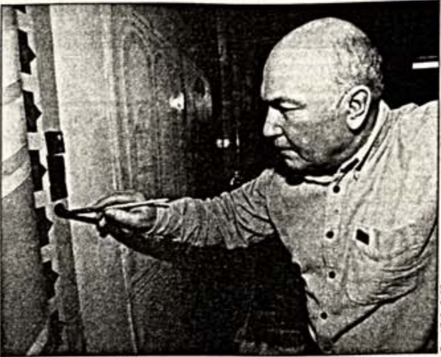
Роспись купола храма Христа Спасителя начнется уже в марте, примерно через две недели. Работы по росписи стен ведутся уже более месяца, их планируется закончить не позднее ноября этого года.