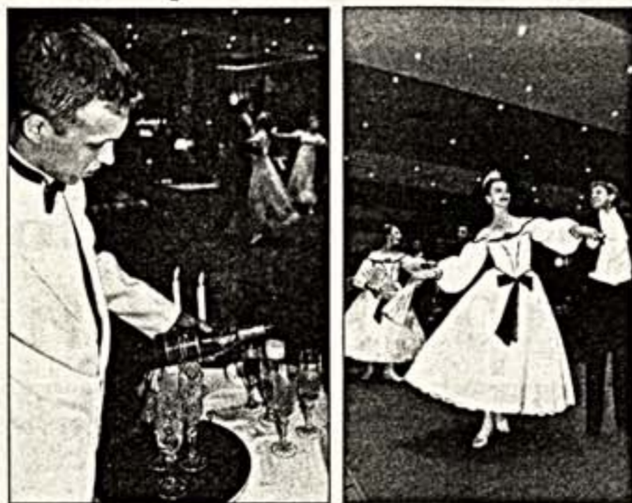
Молодые таланты Большого театра блистали во исполнении благотворительного балу в поддержку юных дарований в столичном оперном клубе "Монголи". Картины романтичного прошлого оживили перед зрителями в "Танцах времен Пушкина" на музыку Чайковского...