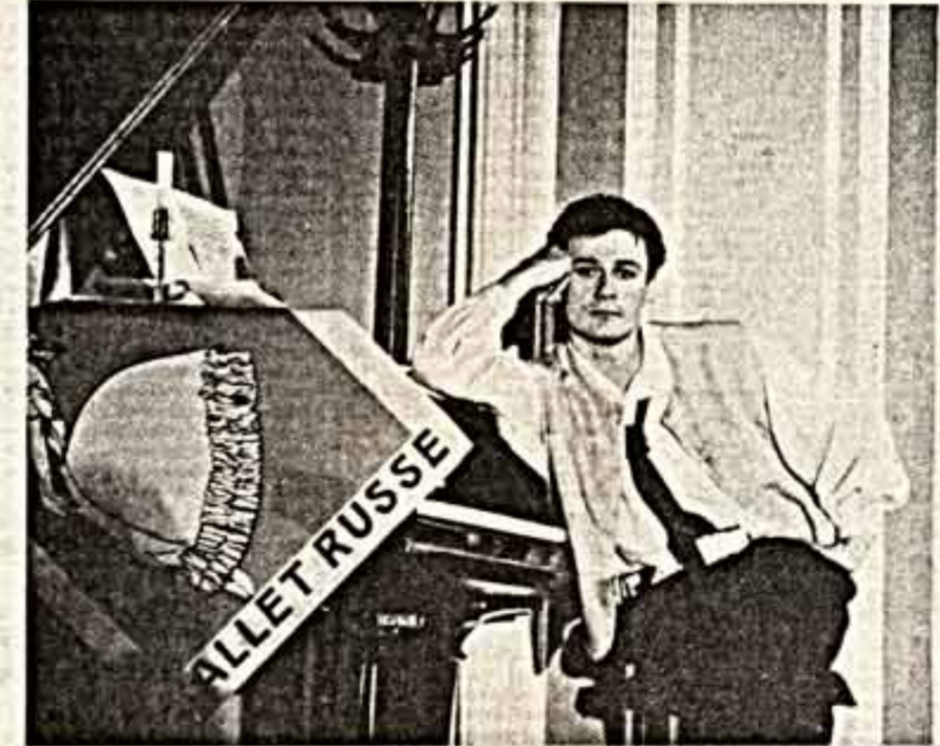
Прошлое — наша память, и не нужно его стыдиться. И какой бы ни была твои Родина...

Вчера в Париже в Театре на Елисейских полях состоялась премьера спектакля «Бюфф