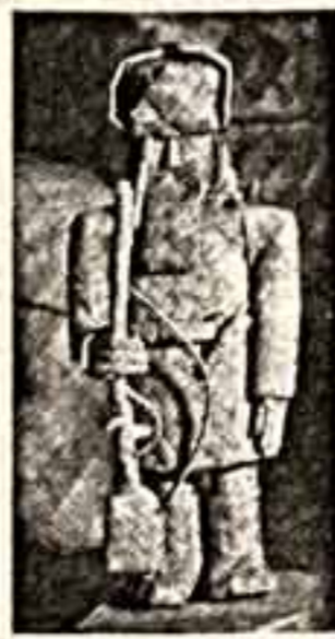
«Мужичко, Автор - В. Пренушка, Санкт-Петербург».