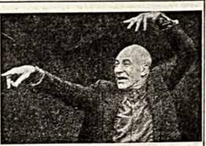
ОДИН В 30 ЛИЦАХ

Кульминацией успеха новой волны эстрады «звезды» стали нынешние новогодние телеконцерты, на которых в студии были собраны все популярные исполнители. Выступавшие ранее в поисках заработка в концертных программах провинции или на свадьбах и в ресторанах, перед