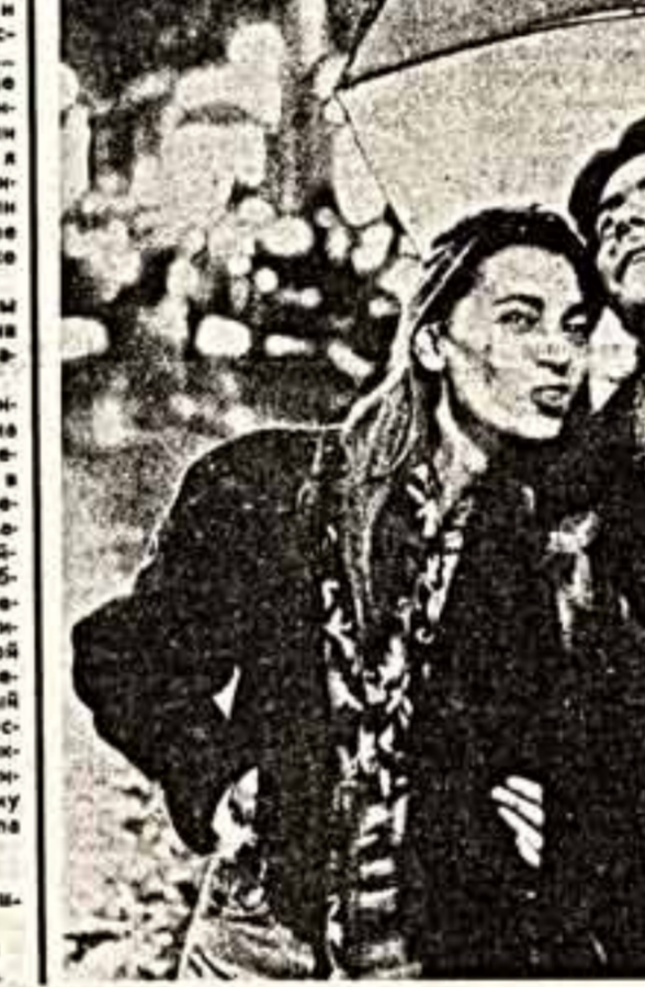
Катрин Слейк в фильме «Длинные ночи».