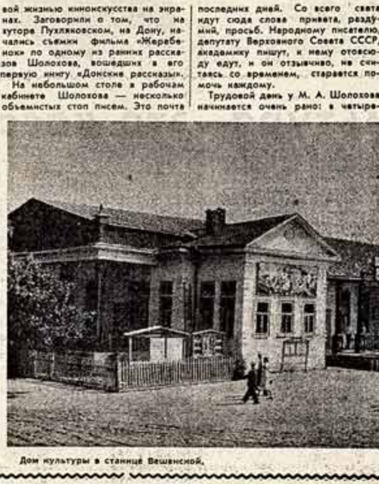
Дом культуры в станице Вешенской.