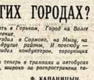
Видела кондукторов, торгующих свежими салатами...

Это, однако, не означает, что число киосков сократится. Напротив, за два года будет построено еще 10 тысяч киосков. В будущем году на улицах крупнейших городов появятся автоматы по продаже газет.