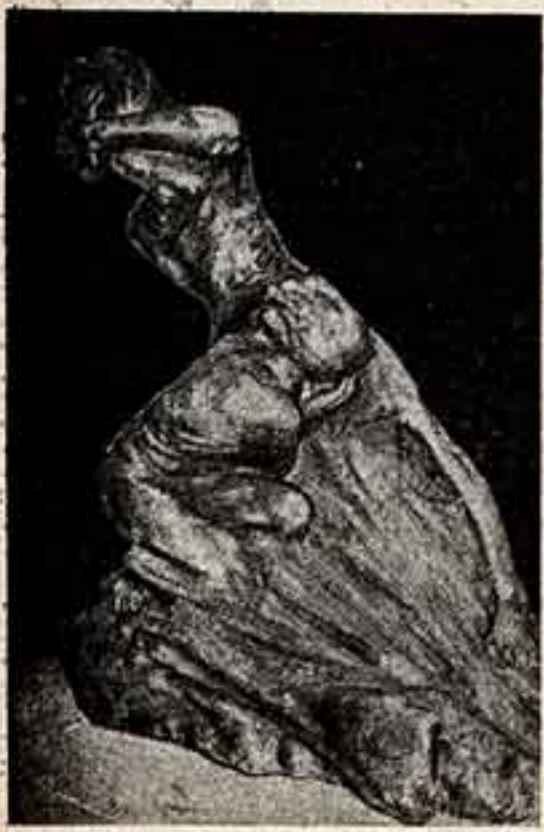
В. Мокуев. «Хирокса».