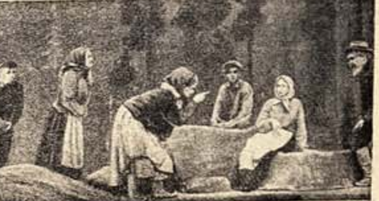
Пьеса финского драматурга Пахала Теуво «На славянской реке»...