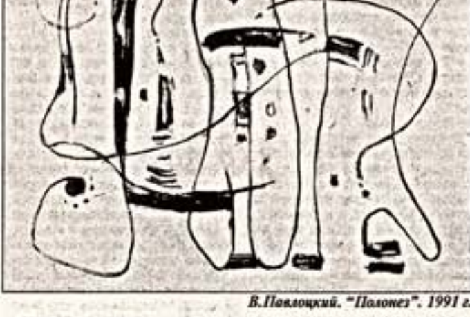
В. Павлоцкий. "Полонез", 1991 г.

Кстати, изображений сугубо официальных лиц у него почти нет. Только замечательные портреты и панорамы зарубежных государств и общественных деятелей.