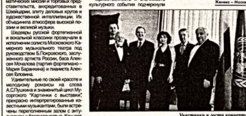
Участники и гости концерта

Уже не первый год крупнейшие европейские столицы принимают у себя участников международного музыкального проекта "Российские миссии".