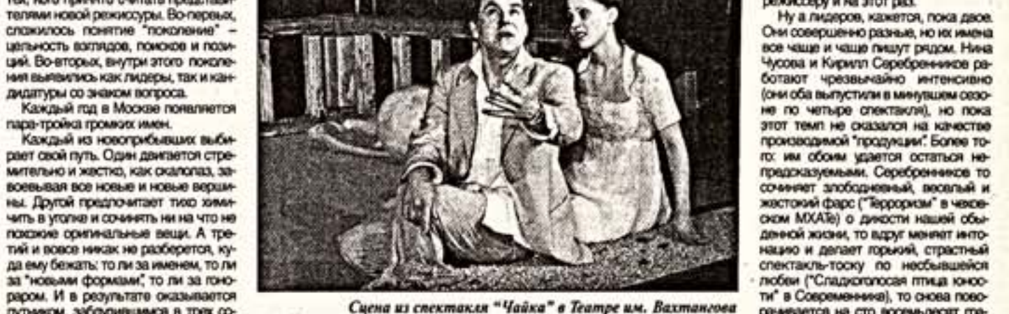
Сцена из спектакля "Чайка" в Театре им. Вахтангова