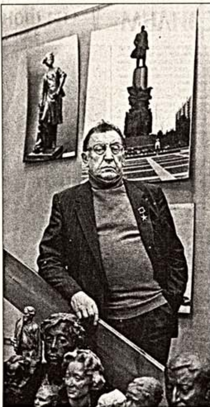
Л. Кербель в своей мастерской

Ушел из жизни выдающийся художник. Так случилось, что за несколько дней до его кончины я побывал в мастерской, где в окружении скульптур, созданных более чем за 60 лет работы Лев Ефимович Кербель. К нему, как и к любому художнику, можно относиться по-разному. Но он запомнит нашу историю — так, что был ее героем и разрушителем. Лев Ефимович Кербель — скульптор, создатель более чем за 60 лет работ Лев Ефимович Кербель.