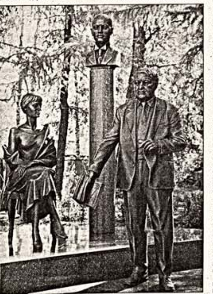
Скульптурная композиция "Семья Гумилевых" в Бежице

Беседа вел Евграф КОНЧИН