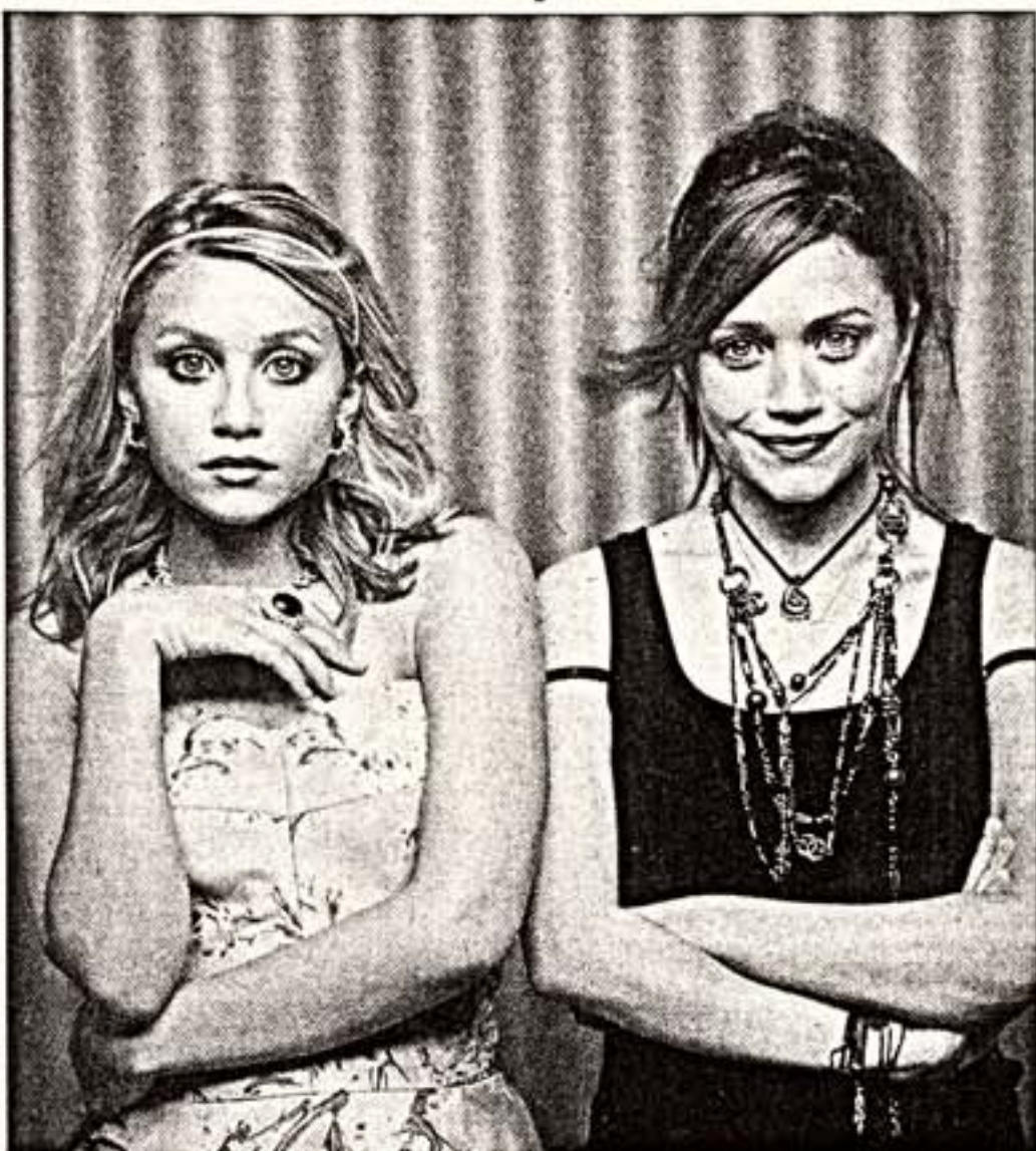
Эшли и Мари-Кейт Олсен