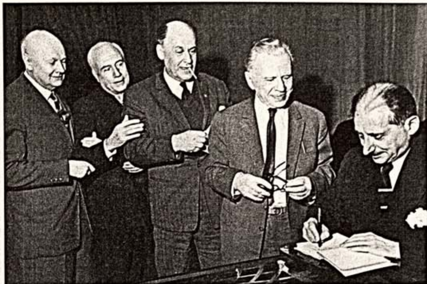
Ю.Юзовский дает автографы В.Топоркову, Б.Ливанову, И.Козловскому и Ю.Завладскому. ЦДА. 17 декабря 1962 г.