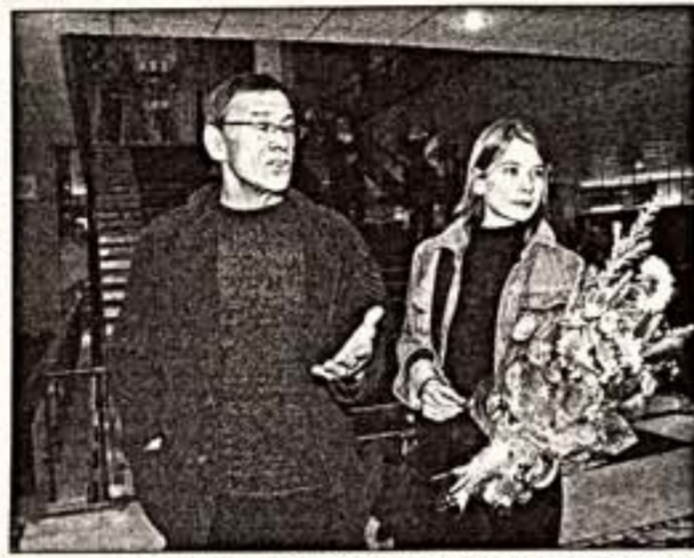
А. Кончаловский и Ю. Высоцкая открывают "Сталкер" "Домом дураков"

Во вторник в Дом кино завершился VIII Международный кинофестиваль "Сталкер", президентом которого является кинорежиссер Марлен Хухвие.