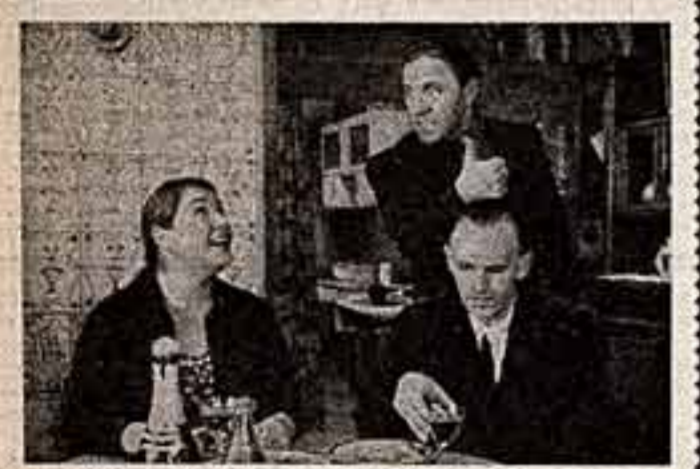
Лида Федосеева-Шукшина, Михаил Ульянов и Станислав Любшин в фильме «Позови меня в даль светлую».