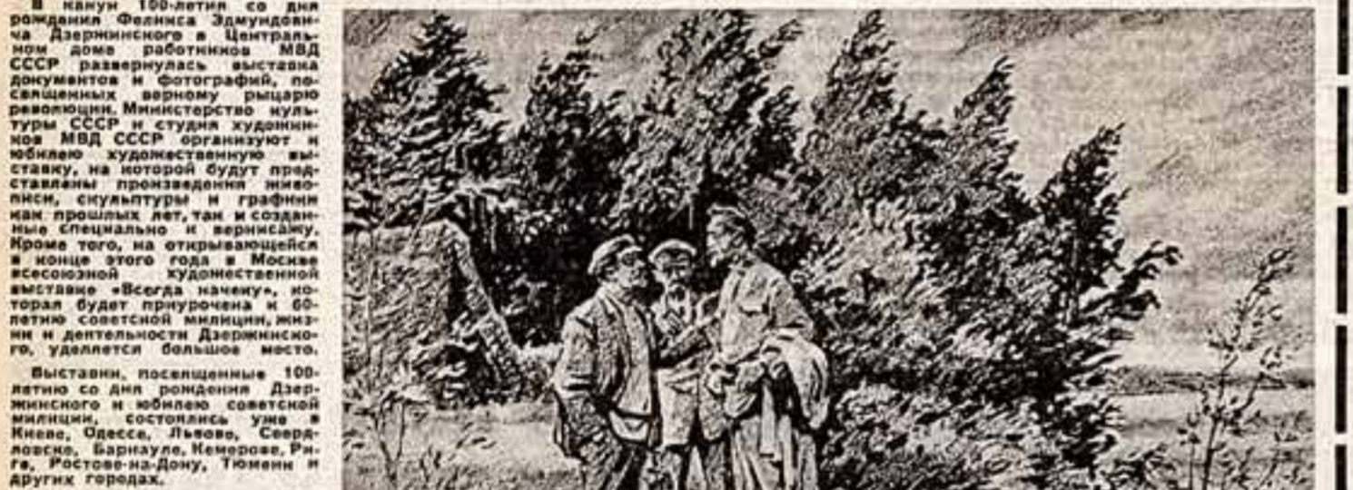
В. Разлив. Рисунок В. Коновалов.