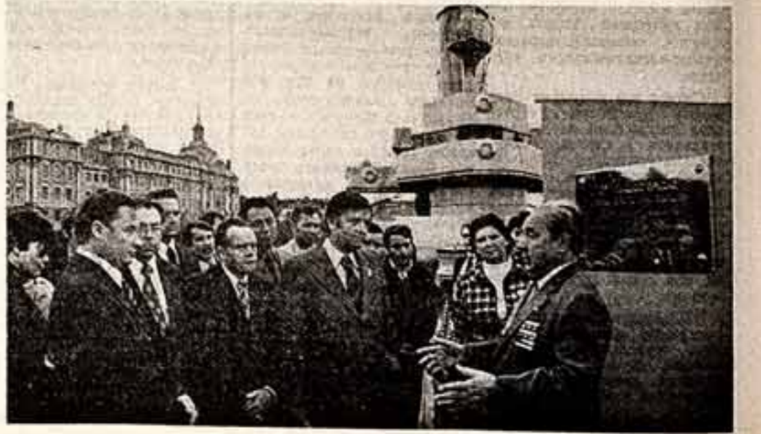
Участники фестиваля во время посещения «Леримо».