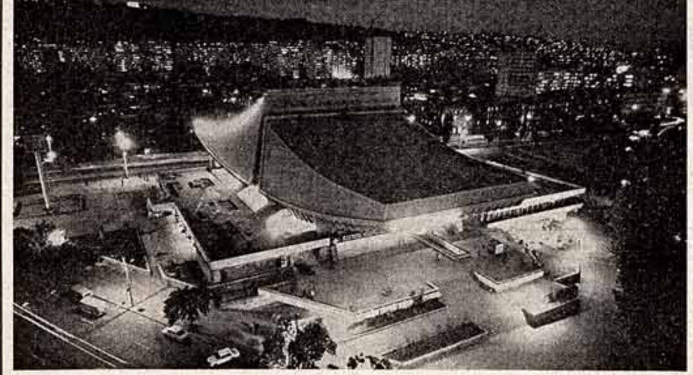
Вечерний Ереван. На переднем плане — здание хикотеатра «Россия».

А. ИСАЕВ, общественный библиотекарь № 12 РАЯНСЬ.