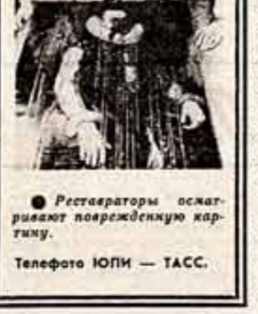
Реставраторы осыпают поврежденную картину.

Этот случай похищения на производстве искусства не единственный. Не так давно в музее Ганновера были облиты кислотой картины великого немецкого живописца Лукаса Кранаха.