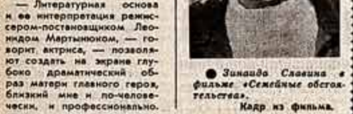
Зинаида Славяна в фильме «Семейные обстоятельства».