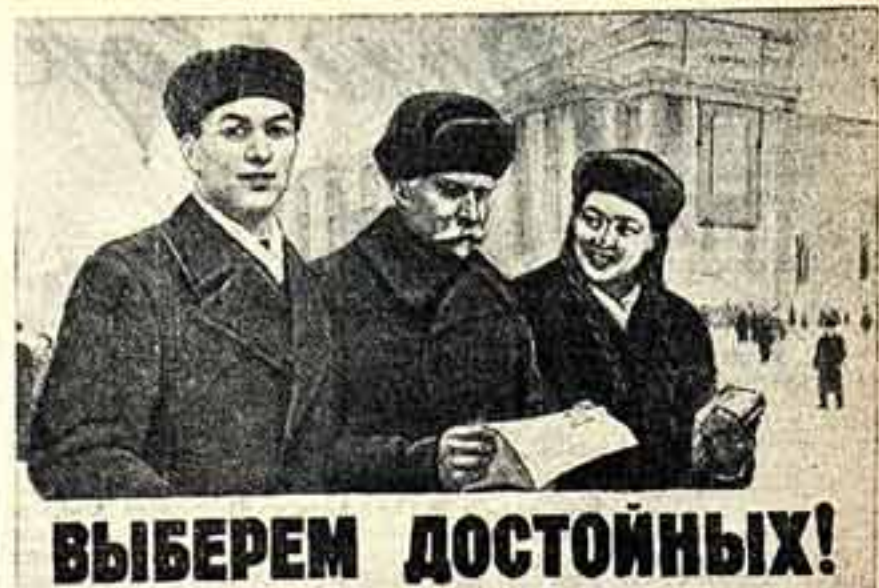
Плакат художников В. Зайцева и Н. Игнатова, иллюстриющий Изюгом.

ХОРОГ Горно-Бадахшанской автономной области.