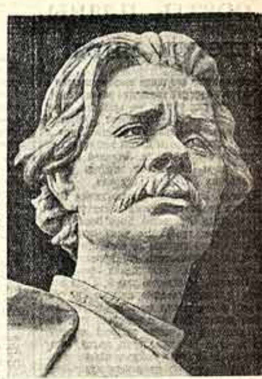
В. Мухина. Памятник А. М. Горькому в г. Горький. Фрагмент модели.

Горький Мухиной — это «востик бури», глашатай права каждого человека из гордости своим именем, это человек, выпрямивший во весь рост в сознании своей свободой и силой. Устанавливая монумент на высоком берегу Волги, скульптор придал стройной фигуре молодого Горького четкость и обаяние ослепления. Облик великого писателя сливается с обликом рабочего — «маторного» первой русской революции, и из этого сплава возникает романтичный образ волевого и сильного