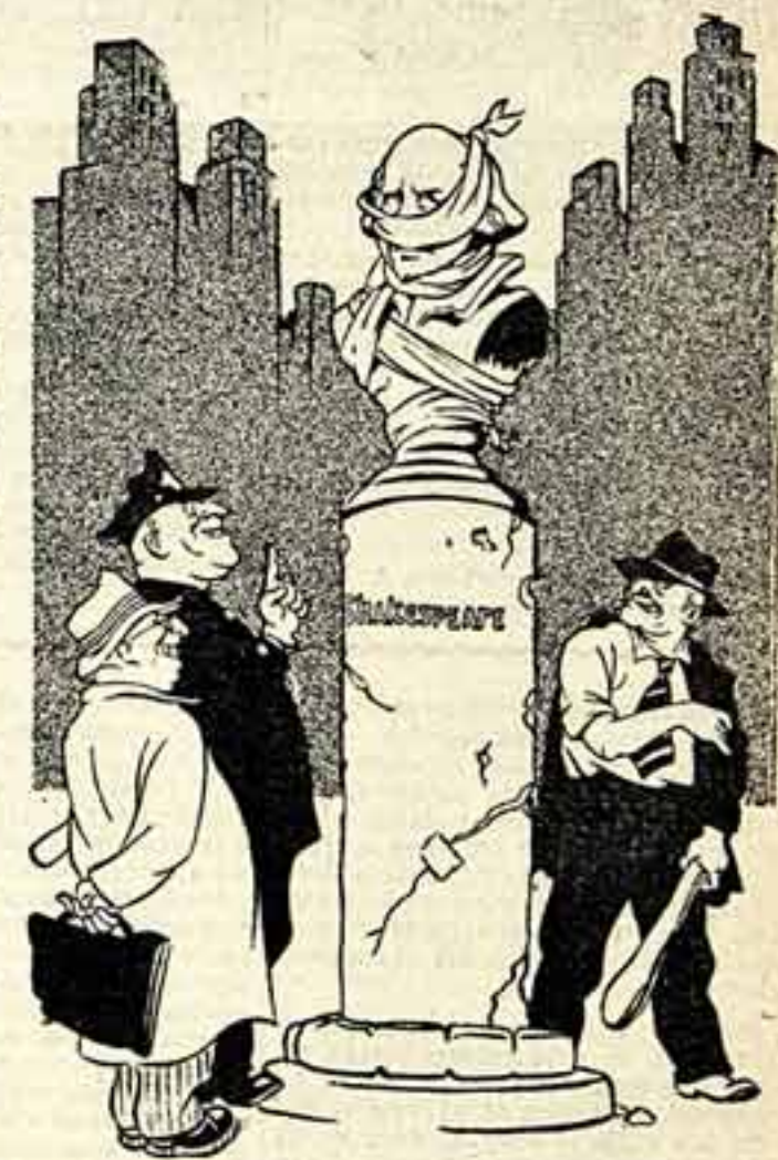
Рис. В. Фомичева.

носить все низкое, пошлое, затупивать в грязь все лучшее в человеке.