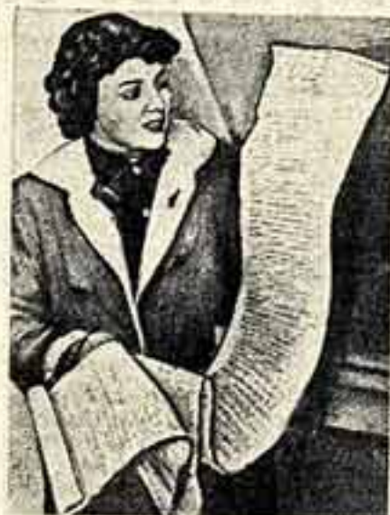
Обращение к властям, которое подписано 3.000 копенгагенцев, проживающих в этой части города.

На снимке, перепечатанном из шведской газеты «Ню Даг», изображена представительница женской делегации одного из районов Копенгагена — Норребро. В ее руках обращение к властям, которое подписано 3.000 копенгагенцев, проживающих в этой части города.