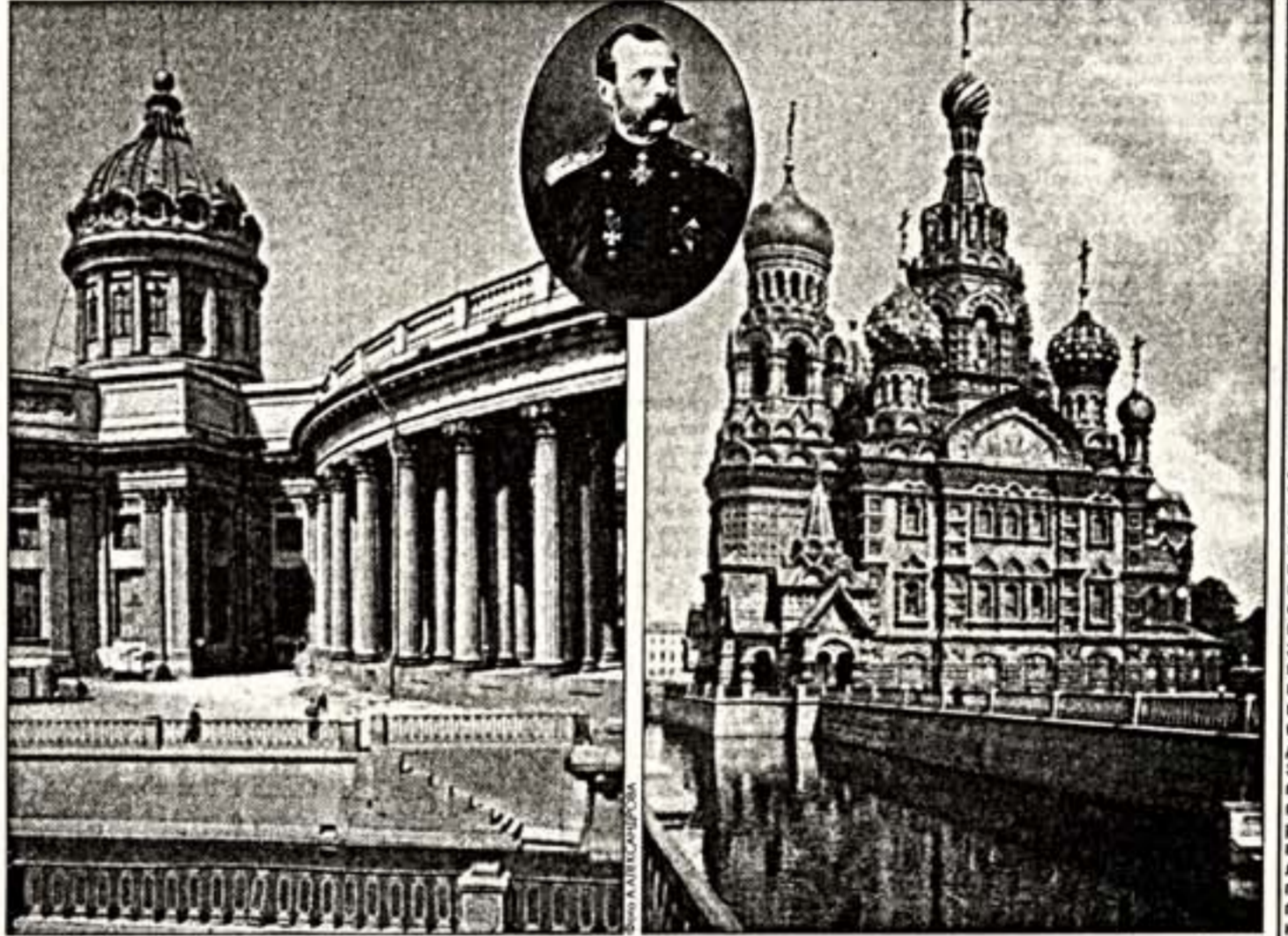
С убийством императора Александра II "толпы" для Петербурга стал "московский стиль". Слева: шедевр классицизма — Казанский собор...