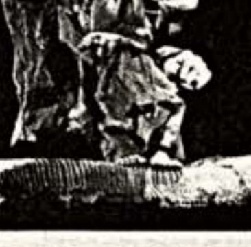
Сцена из спектакля "Фауст 1"