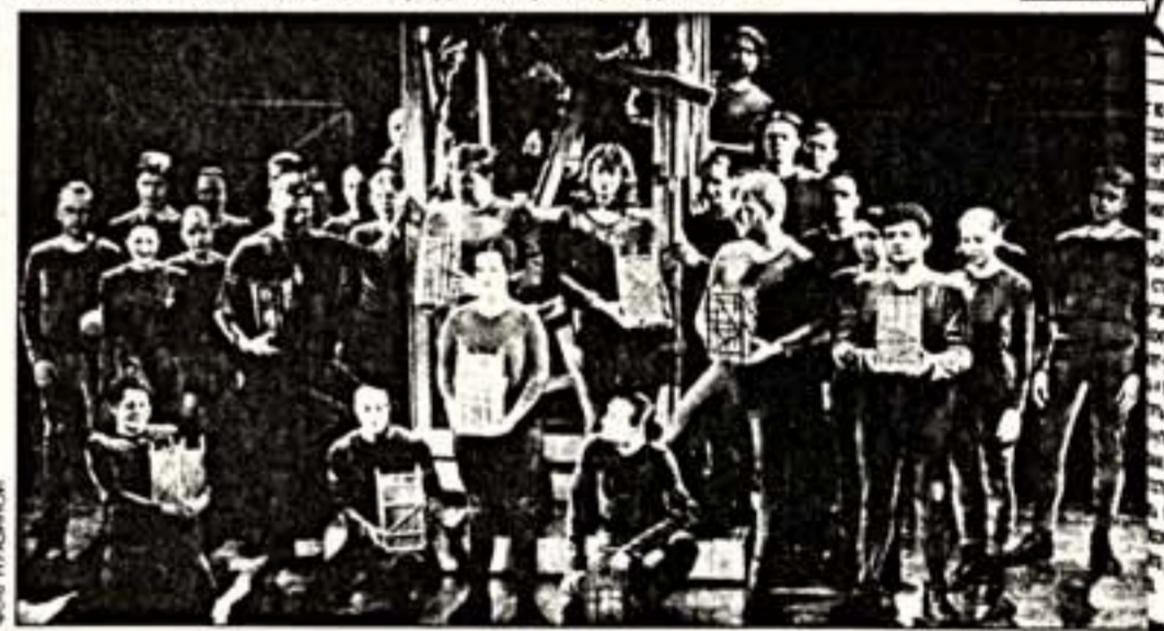
Сцена из спектакля «Царь Демьян»