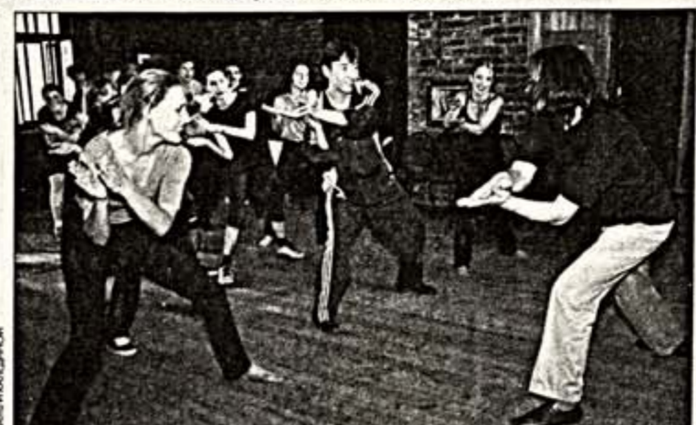
Этюд для мастера

Юрий Любимов - признанный корифей в области музыкального театра.