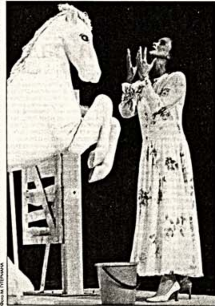
Л. Полищук - Лягушка в сцене на спектаклях