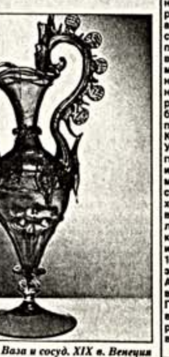
Ваза и сосуд. XIX в. Венеция