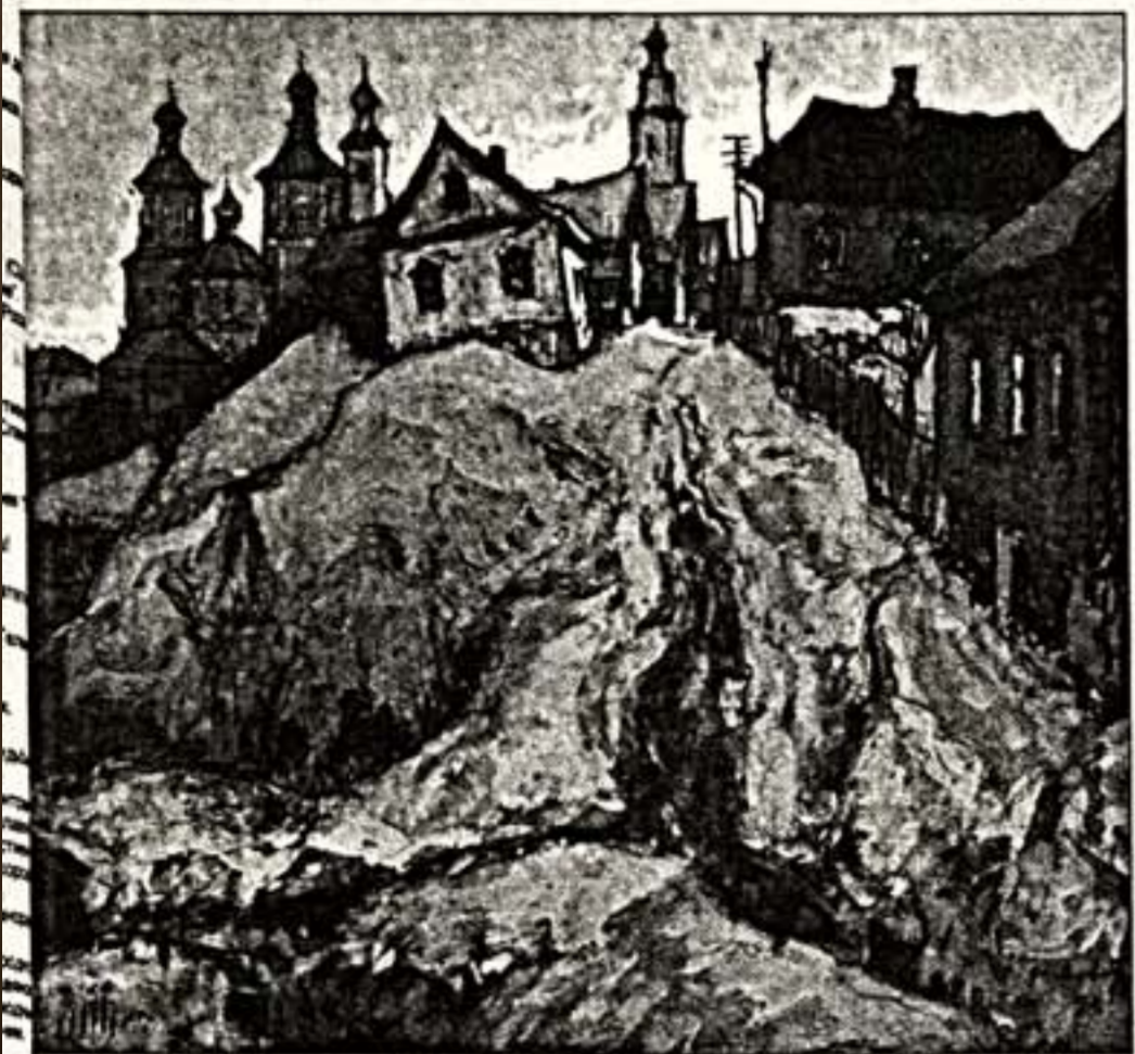
К. Горбатов. "Вечер в русской провинции". 1931 г.

К 125-летию со дня рождения Константина Горбатова