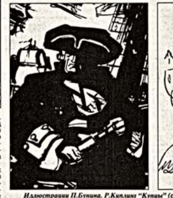
Иллюстрации П.Бунина. Р.Киллин "Купцы" (слева) и П.Мерин "Этруская ваза" (справа)