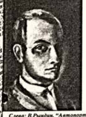
Слева: В.Рындин. "Автопортрет". 1923 г. Справа: эскиз декорации к спектаклю "Дон Кихот"