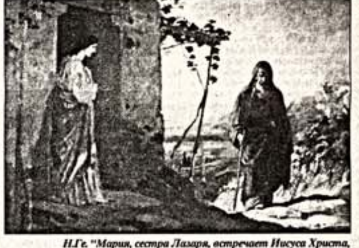
И.Г.Г. "Мария, сестра Лазаря, встречает Иисуса Христа, идущего к ним в дом". 1820 г.

ко полно оно представлено на выставке. Триумфальным шествием можно назвать произведения четырех художников - Максима Воробьева, братьев Григория и Николая Черныцевых и разумеется, Василия Поленова.