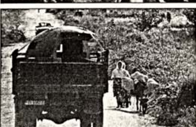
Кадры из фильмов "На пути в Кандагар", "Сестры", "Тирани, год нулевой"

рова, уже успевшие объездить почти майской премьеры в Сочи почти весь вечер, в Греции были приняты весьма благосклонно. Залы были полны (впрочем, мне уже доводилось писать на страницах "Культуры", что являлись на фестивале любители искусства - вещь за пределами искусства). Никто не утверждал, что фильм является шедевром, но все отменили свежесть сюжета, естественность исполнения, режиссерскую уверенность. Говорили,