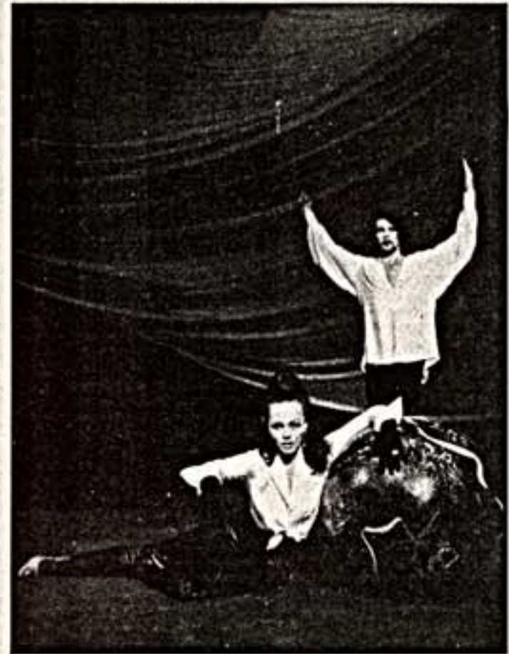
Сцена со спектакля

"Страсти по Утрате" ("Зимняя сказка") в театре драмы