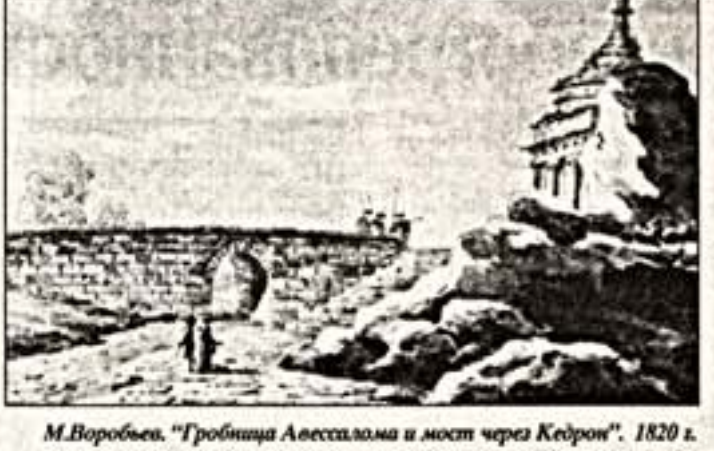
М.Воробьев. "Гробница Авессалама и мост через Кедрон". 1820 г.