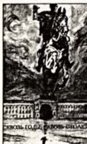
Сколько годы, сколько столетия

Альбом задуман и выполнен в единственном экземпляре. Это не просто книга, это произведение искусства, это произведение искусства.