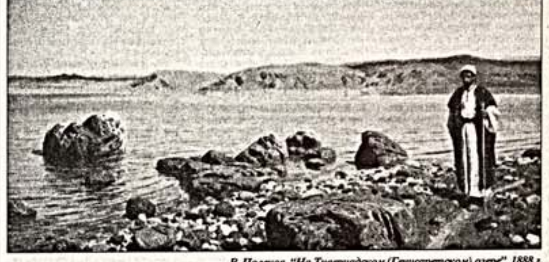
В.Поленов. "На Тивериадском (Генесаретском) озере". 1888 г.

Впрочем, это можно отнести и к ученикам Воробьева - братьям Григорию Григорьевичу Черныцеву (1802 - 1865) и Николаю Григорьевичу Черныцеву (1805 - 1879). Палестину они посетили в 1840 - 1841 годах.