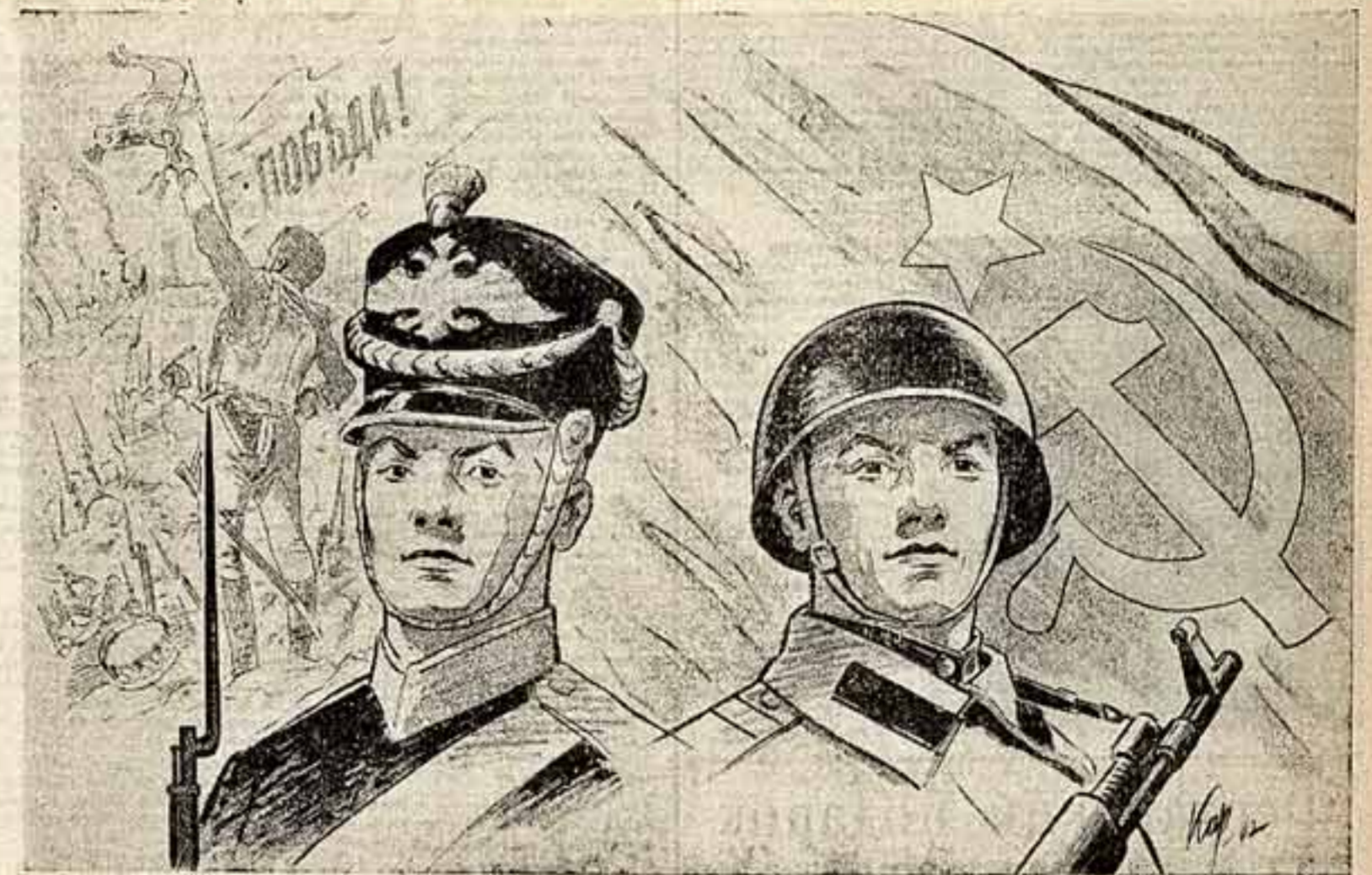
Рисунок заслуженного деятеля искусств Казахской ССР Н. КАРПОВСКОГО.