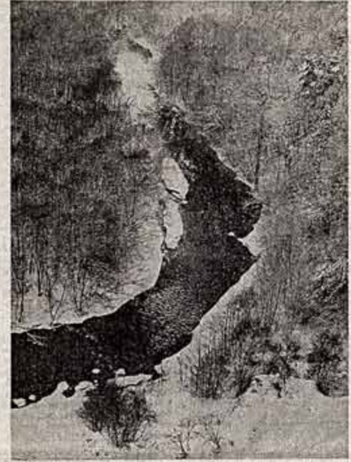
Б. МИШКИН. ШЯУЛЯЙ.