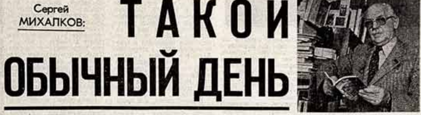
Сергей Михалков: ТАКОЙ ОБЫЧНЫЙ ДЕНЬ