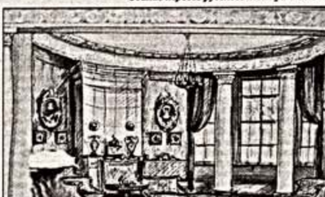
Эскиз декорации И. Штенберг к спектаклю “Горе от ума”, 1954 г.

И. Гомсузур и И. Мешотистура в сцене из спектакля “Жизнь прекрасна”