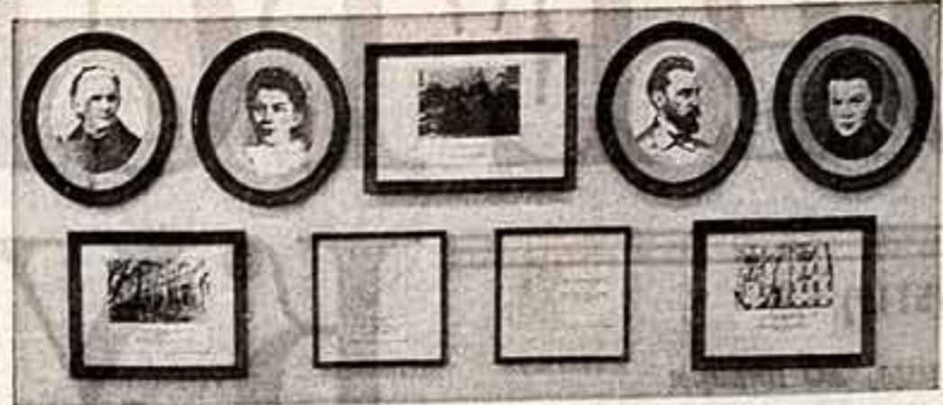
Эти снимки сделаны в Киеве, в новом мемориальном доме-музее «Революционная деятельность семьи Ульяновых на Украине». В экспозиционном зале. Письменный стол в комнате Марии Ильиничны, за которым она, по поручению В. И. Ленина, села переписку с местными партийными организациями РСДРП.