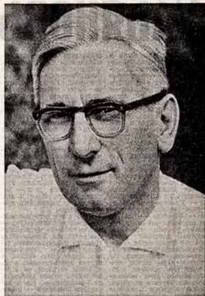
Анатолий ВЫСТОРОБЕЦ, кандидат искусствоведения

Ф. РЕШЕТНИКОВ, народный художник СССР, вице-президент Академии художеств СССР.