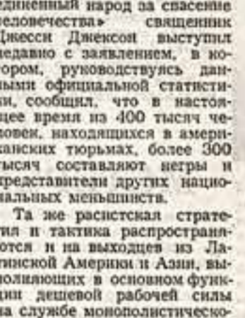
Клод ЛАЙФУТ: «В МОИХ глазах статуя Свободы в Нью-Йорке была прикрываем, на которой на городских площадях закивали тысячи моих черных матерей и отцов, братьев и сестер. Я помню, что в обществе, разделенном на классы, демократия невозможна как для белых, так и черных. С момента зарождения американской нации по настоящее время правительство всегда делало то, что было в интересах большого бизнеса...»