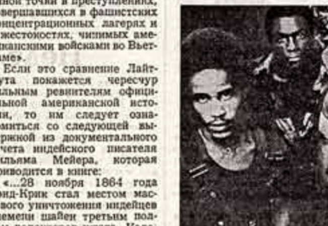
Клод ЛАЙФУТ: «В МОИХ глазах статуя Свободы в Нью-Йорке была прикрываем, на которой на городских площадях закивали тысячи моих черных матерей и отцов, братьев и сестер. Я помню, что в обществе, разделенном на классы, демократия невозможна как для белых, так и черных. С момента зарождения американской нации по настоящее время правительство всегда делало то, что было в интересах большого бизнеса...»

Автор проливает новый свет на историю Соединенных Штатов, а с помощью убедительных аргументов доказывает, что «колониализм» и затем нация родилась в обстановке жестокого классового и беспринципного расового угнетения. «Ни революция, ни конституция не изменили характер этого угнетения, а лишь значительно усилили его», — пишет он. — Эти элементы в национальной истории обычно игнорируются или приуменьшаются. Описывая период колонизации Америки, который здесь пытаются представить в романтически-идеологическом виде, Лайфут отмечает, что программа первых поселенцев заключалась в захвате земель, изгнании и уничтожении индейцев, а также приобретении богатств. Это послужило началом варварской войны, которая достигла своей кульминации