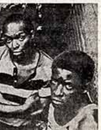
Клод ЛАЙФУТ: «В МОИХ глазах статуя Свободы в Нью-Йорке была прикрываем, на которой на городских площадях закивали тысячи моих черных матерей и отцов, братьев и сестер. Я помню, что в обществе, разделенном на классы, демократия невозможна как для белых, так и черных. С момента зарождения американской нации по настоящее время правительство всегда делало то, что было в интересах большого бизнеса...»