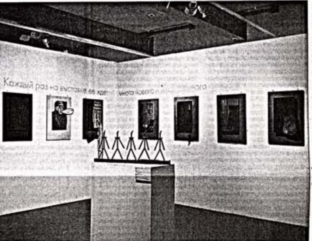
Логично смотрится рядом металлическая скульптура “Спецназ” (2003) И.Шелковского и смеющаяся инсталляция из картин на дереве “Каждый раз на выставке ее ждет много нового и неожиданного” (1993) М.Рогинского — “русских парижан” с молчаливым стазем. Впрочем, Шелковский вернулся в Россию, а Рогинский умер в 2004 году