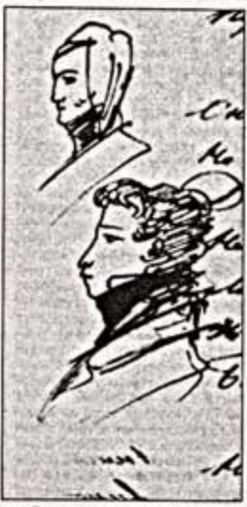
Справа: А.Пушкин. Автопортрет