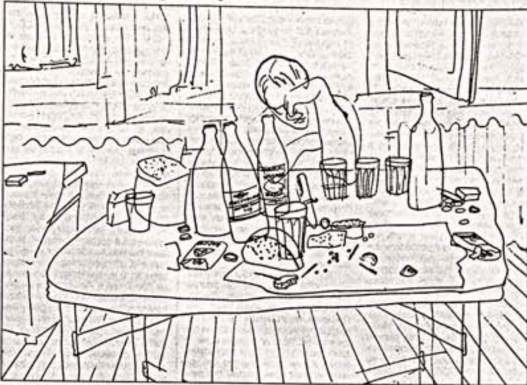
Ю. Королев. "Похмелье". 1960-е гг. (сверху) и "Злата улица". 1983 г.