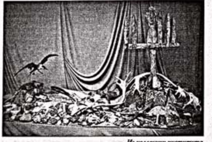
Из коллекции института