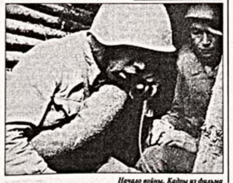
Начало войны. Кадры из фильма