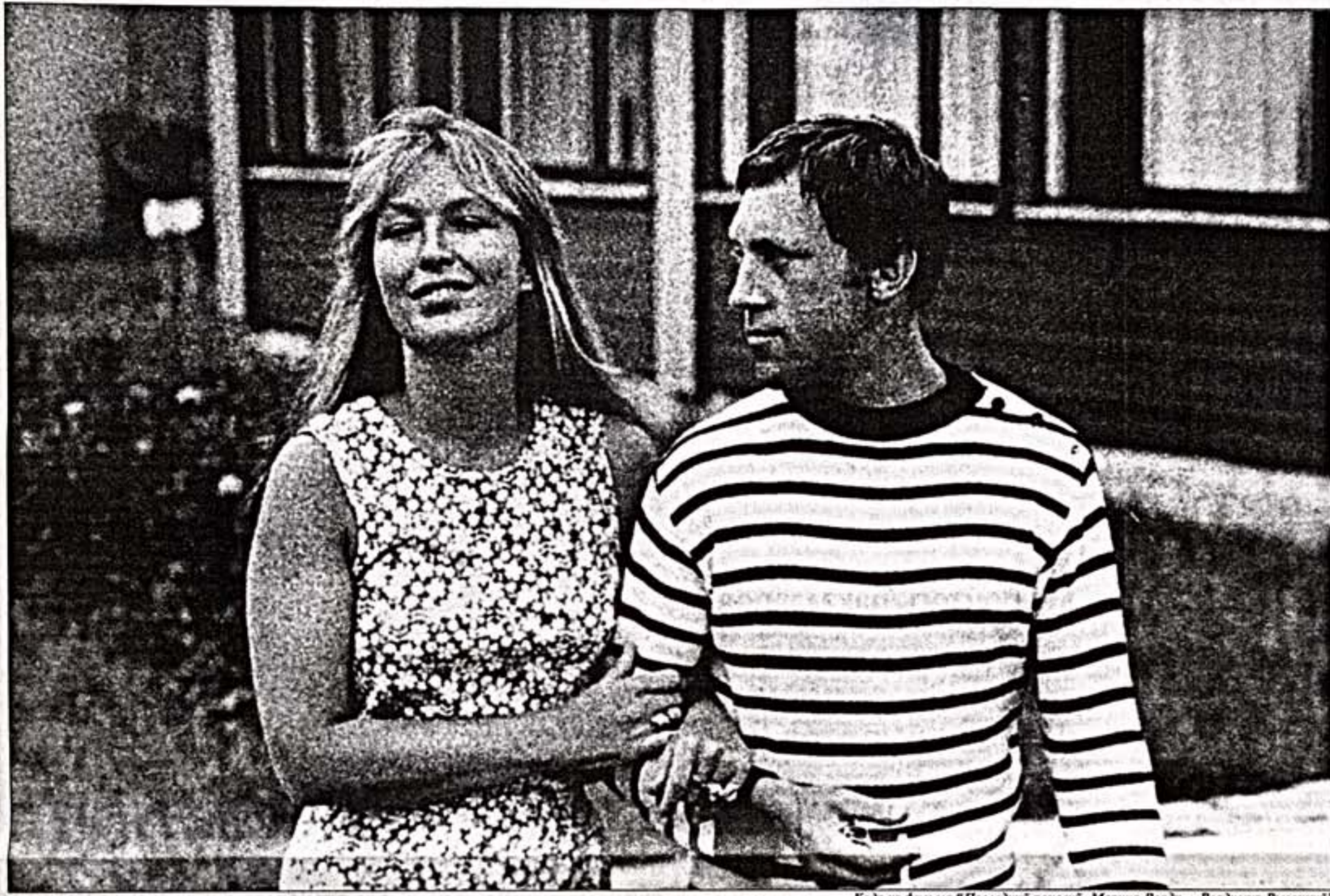
Кадр из фильма «Последний поцелуй». Марина Влади – Владимир Высоцкий