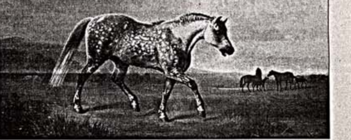
А.Шабал. "Серая рысистая лошадь на ходу". 1859 г.

В итоге проект галереи не столько дает представление о развитии "иппического жанра" в России, сколько (в той или иной степени) об искусстве всего общественного искусства двух последних столетий.