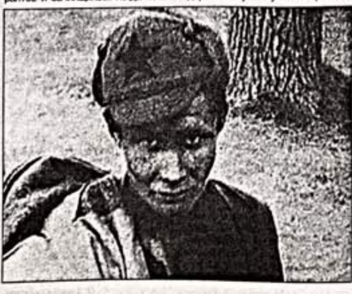
Начало войны. Кадры из фильма