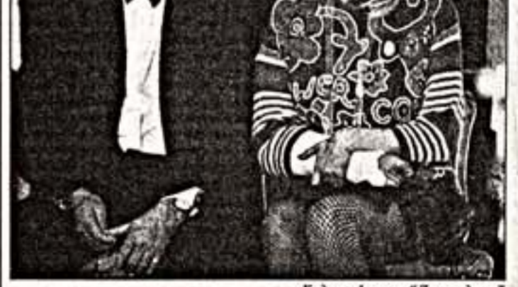
Кадр из фильма "Два в одном"