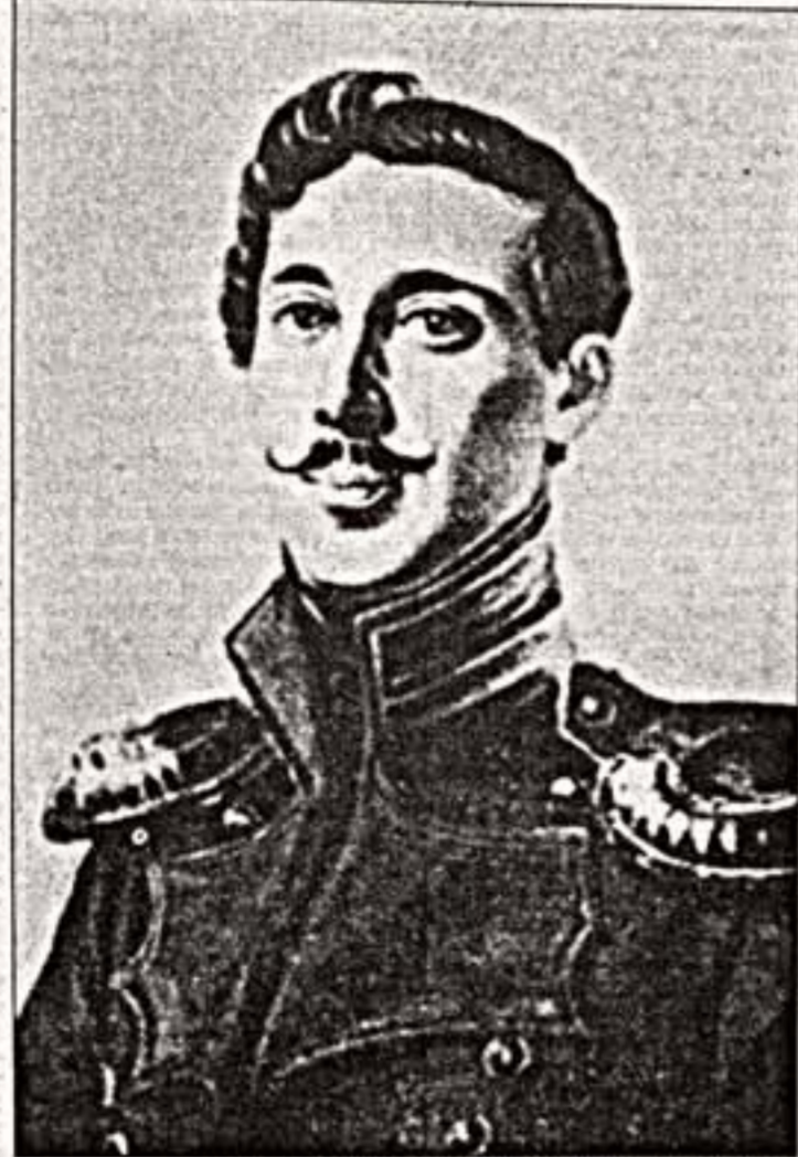
Слева: Г.Ген. "Портрет И.Липранди", 1820-е гг.

Так начинается новый период жизни нашего героя, ознаменованный дружбой с величайшим поэтом России. Несмотря на разницу в десять лет, они быстро подружились. Пушкин