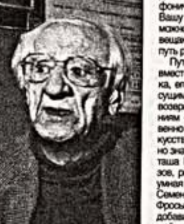
Б.Покровскому — 96

Мне довелось участвовать в трех прокофьевских операх, поставленных Вами. Это — “Война и мир”, “Обучение в монастыре” и “Семья Котло”. Во всех трех постановках и ощущал некое чудо. Ваш личный вклад не действовал в Париже. Работа с Вами помогла мне увидеть и услышать музыку Прокофьева под особым, острым, покровным углом зрения, что очень помогло мне при исполнении его симфонических сочинений, в том числе предпринимать