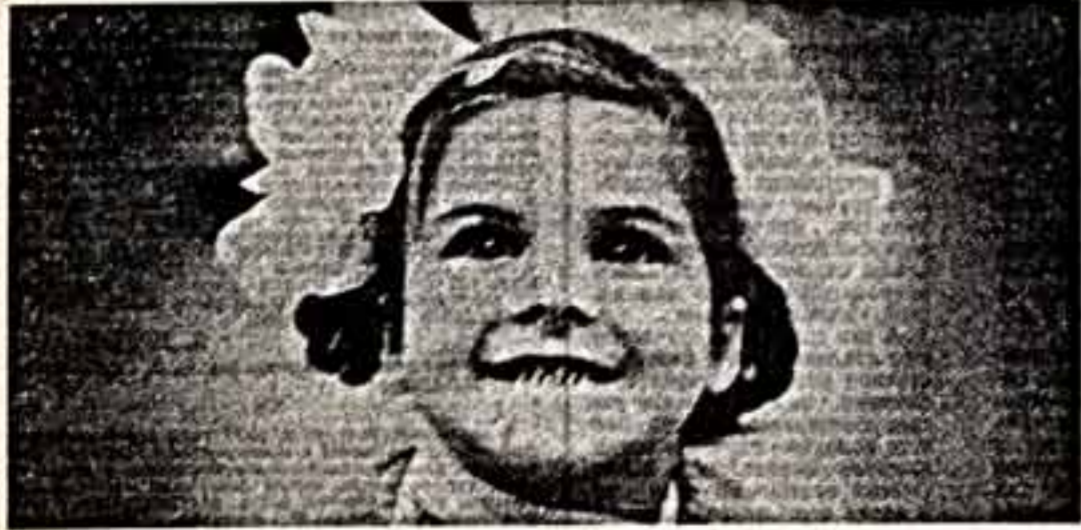
● Оригинальное здание театра с его типичным оформлением является собой подлинное украшение Юго-Запада столицы. ● Особняком в главном репертуаре театра Героя Социалистического Труда, народная артистка СССР, лауреат Ленинской премии Наталья Соц. ● Так репертуар на театральное бытие только дети. ● Сцена из оперы «Ворог арлеки», музыка А. Чайковского. ● Фото А. Ягудина.

Зрители принимают еще задолго до начала спектакля и еще издали видят кинооптику. Присматриваясь к экрану, она приглашает войти в мир музеев.