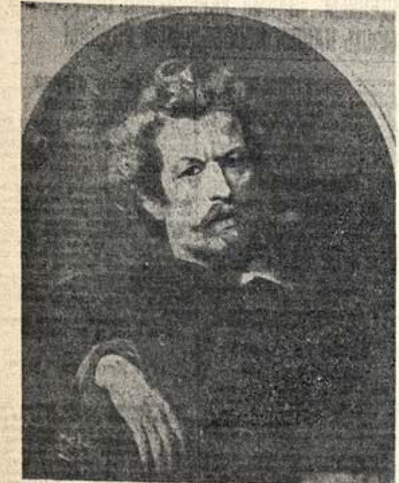
Карл Павлович Брюллов (1798—1852). Автопортрет. И 85-летие со дня смерти художника.