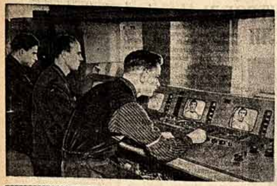
Видеоскопический телевизионный центр построен недавно. Основная аппаратура поступила сюда из Москвы, Ленинграда, Харькова и других городов страны в начале нынешнего года. На снимке: многопарный пульт. Идет передача.

Найденные письма относятся к последнему периоду жизни Чайковского 1888—1893 годам. В них композитор рассказывает о таких произведениях, как симфония «Майфред», опера «Чародейка» и «Чародейка», симфоническая сюита № 2, № 3 и «Юланта», Пятая симфония, увертюра «Гамлет» и оркестровый баллад «Воевода», балеты «Спящая красавица» и «Щелкунчик», опера «Пиковая дама» и «Юланта», шестая симфония («Патетическая») и Третий фортепианный концерт.