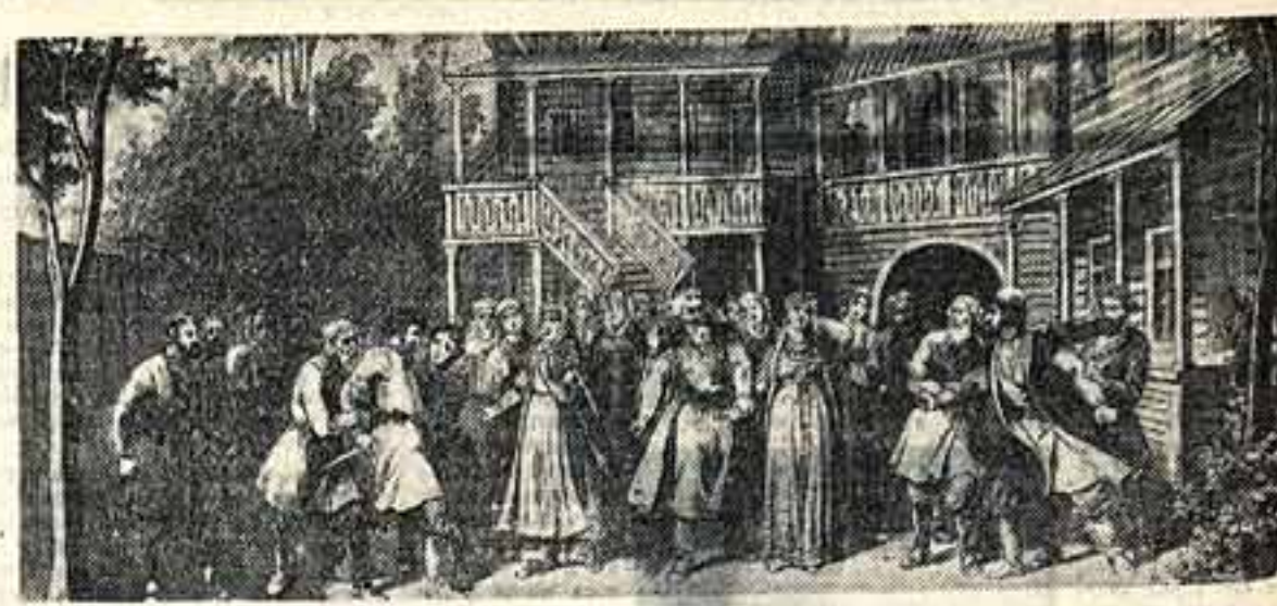
Опера Чайковского «Воевода» (финал) в Большом театре в Москве (1899 год)