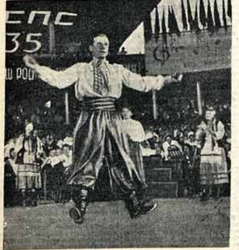
«Голос» в исполнении солистки Лубянской трудовой коммуны на олимпиаде музыки и танца