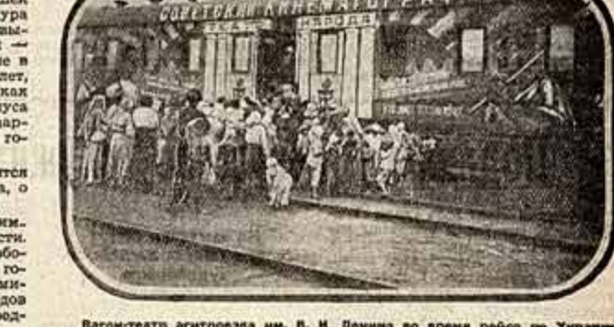
Вагон-театр агитпоезда им. В. И. Ленина во время рейса по Украине. (1919 г.).