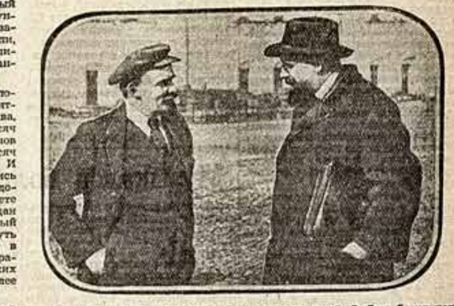
В. И. Ленин на прогулке в Кремле беседует с В. Д. Бонч-Бруевичем (1918 год).

В архиве сохранились фотографии, ни более чем вековой давности. Первые из них запечатлели обороту Севастополя в 1854—1855 годах, русско-турецкую войну семидесятых годов, панораму городов той поры. А первая запись, пред-