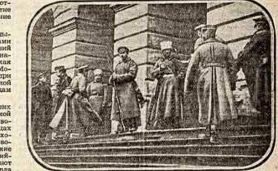
Первые кадры советского документального кино Смольный 26 октября 1917 года.