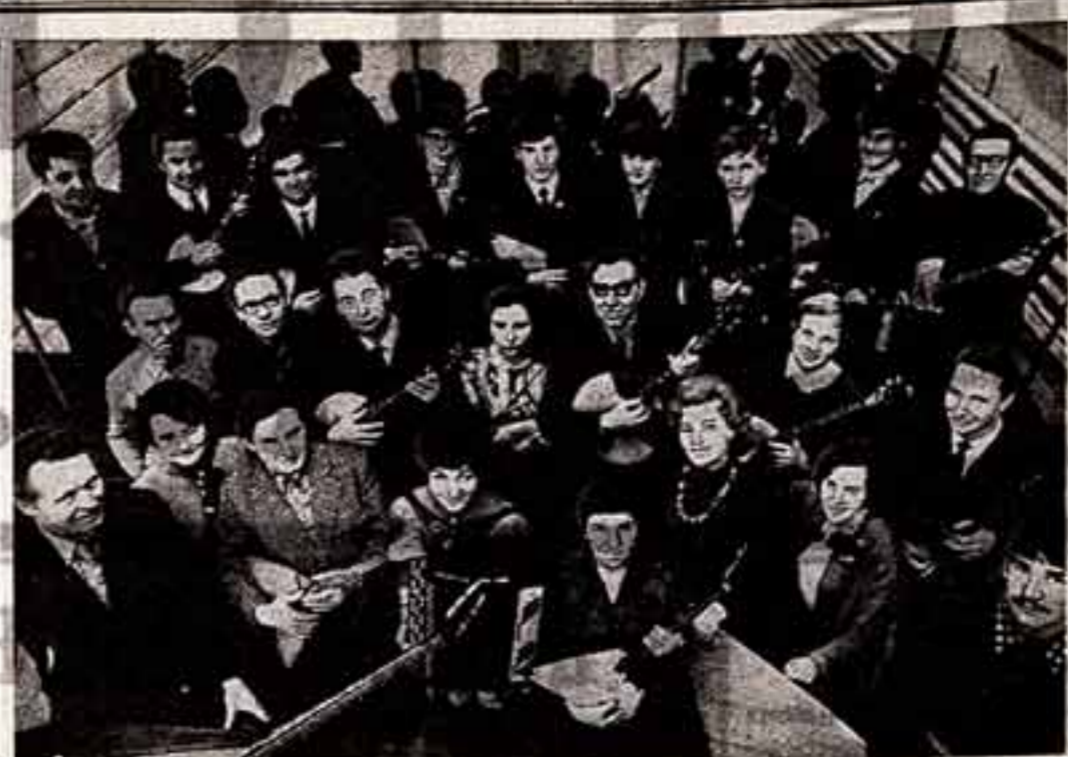
В 1965 году ученики, инженеры и рабочие Сибирского отделения Академии наук СССР создали при доме культуры «Академик» оркестр народных инструментов...