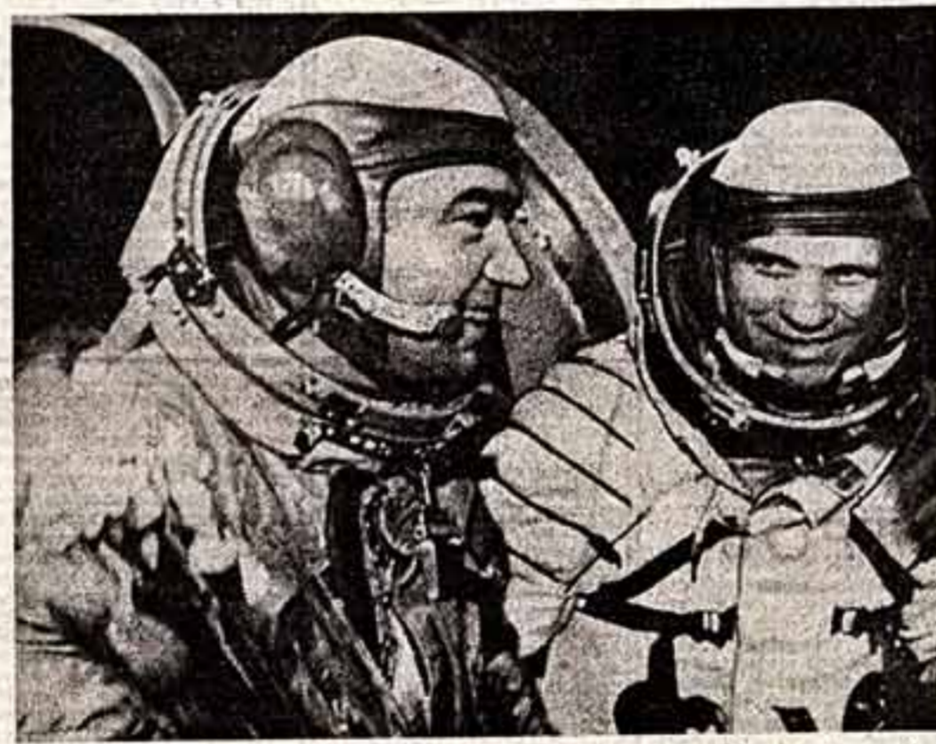
Экипаж космического корабля «Союз-17»: командир корабля Алексей Александрович Губарев и бортинженер Георгий Михайлович Гречко (справа).

В соответствии с программой исследований в околоземном космическом пространстве 11 января 1975 года в 0 часов 43 минуты в Советском Союзе осуществлен запуск космического корабля «Союз-17». Космический корабль, выведенный на расчетную орбиту искусственного спутника Земли, плотирует экипаж в составе командира корабля подполковника Губарева Алексея Александровича и бортинженера кандидата технических наук Гречко Георгия Михайловича. После выведения корабля «Союз-17» на околоземную орбиту космонавты товарищ Губарев и Гречко приступили к выполнению программы полета.