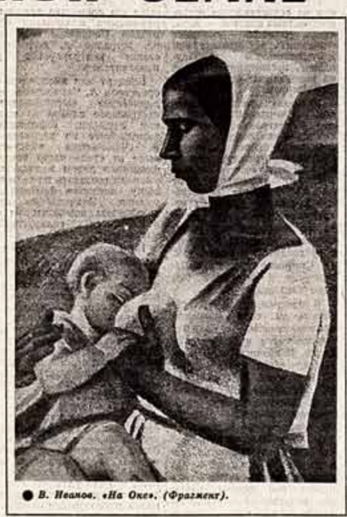
В. Иванов. «На Оке». (Фрагмент).