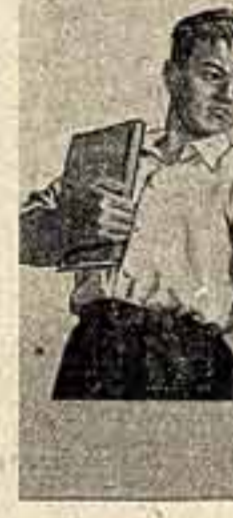
Плакат художника Тао Моу-чжи «Отстой конституции» и картина художницы У Си-пин «Чей лучше?».

Следует отметить, что на этой выставке очень успешно выступила молодежь.