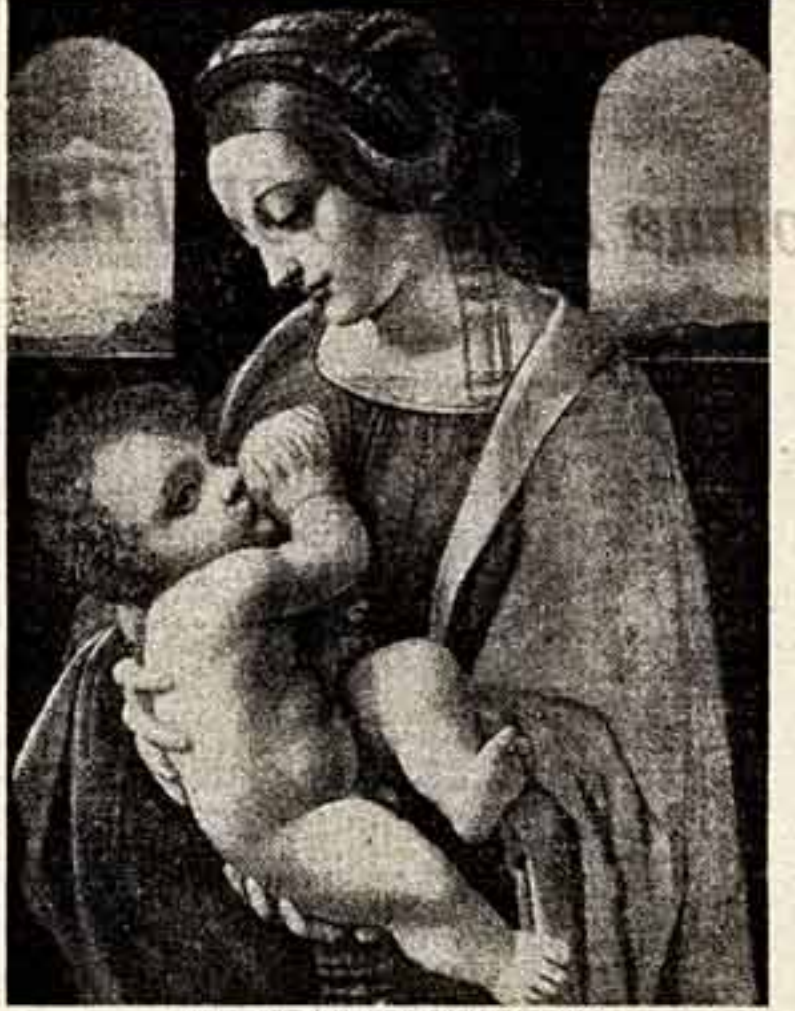
ЛЕОНАРДО да ВИНЧИ. Мадонна Литта.

Сохраняя, изучая и пропагандируя ценности мировой культуры, Эрмитаж служит делу просвещения, эстетического воспитания нашего народа, он стал подлинно народным музеем.