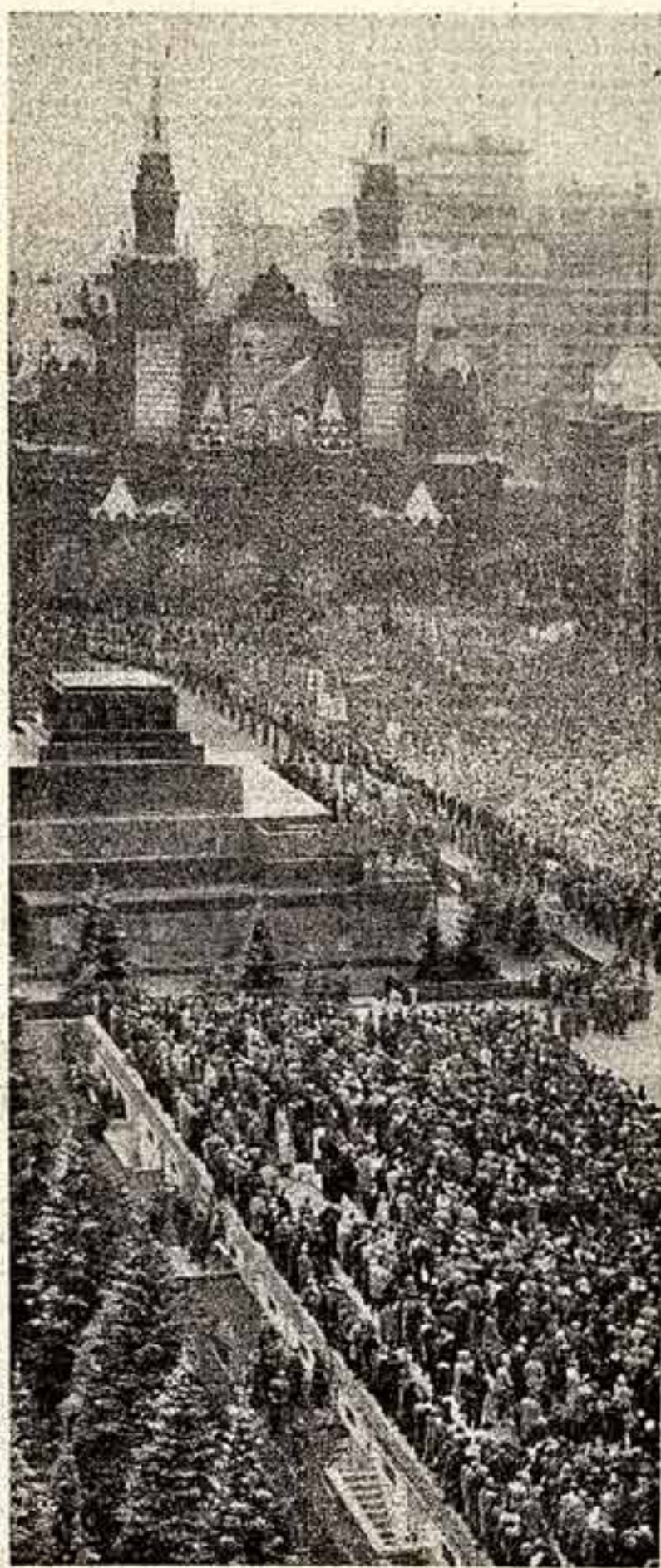
МОСКВА, Красная площадь, 19 октября 1964 года.

19 октября столица нашей Родины Москва встречала своих славных сыновей, героев-космонавтов В. Комарова, К. Феоктистова, Б. Егорова. Прибывших в Москву героев космоса на Внуковском аэродроме ожидали товарищи Л. И. Брежнев, Г. И. Воронов, А. П. Кирилленко, А. Н. Косыгин, А. И. Микоян, Н. В. Подгорный, Д. С. Полянский, М. А. Сусленко, Н. М. Шверник, Л. Н. Ефремов, П. И. Демичев, Л. Ф. Ильичев, В. И. Ползиков, Б. Н. Пономарев, А. П. Рудakov, В. Н. Титов, А. Н. Шелешин и другие.