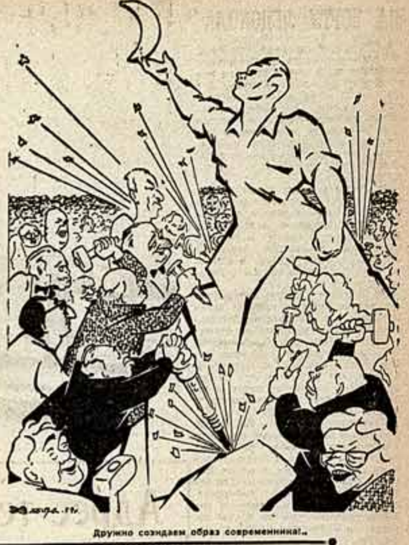
Дружно создаем образ современника...

ПРЕОБРАЗОВАНИЕ самостоятельного театрального коллектива в народный театр — это сложный процесс. От любительства, обычно отсутствующего дилетантизмом, как метод определила его великий русский драматург А. Н. Островский, коллектив театральной самостоятельности обязан освобождаться, заменяя его подлинной умелостью, богатством профессиональных знаний и навыков. Наша мечта — овладение второй профессией, совершенно не связанной ни с какой материальной заинтересованностью. Это огромная, труднейшая задача. Чтобы решить ее, мало освоить основы искусства актера, спонсическую речь, грим. Это лишь начало. Нельзя забывать такие компоненты жизни театрального коллектива, как работа постановочной частью, организация театрального процесса, оформление спектакля, светотехника, внутренняя распорядок и еще многое другое. Как это приобрести, как этому научиться? Если два театра — профессиональный и самостоятельный, будут жить как бы одной жизнью, если мы сможем постоянно получать помощь и советы мастеров сцены, процесс превращения самостоятельного коллектива в творчески жизнеспособный народный театр пойдет значительно быстрее и успешнее.