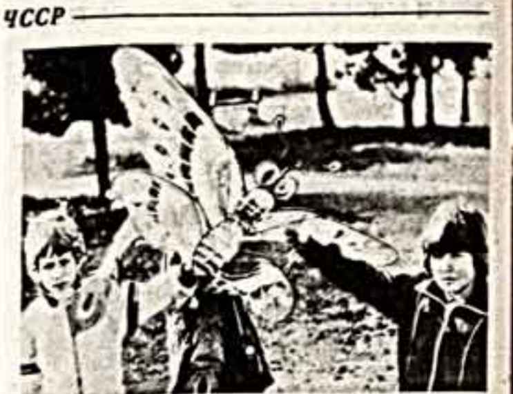
Волонтеры Азии — одно из республиканских учебных подразделений населения ЧССР. С большой любовью и энтузиазмом ребята работают в рамках программы «Воздух — детям», а затем соревнуются. В яркой форме Лига содействия демократии китайских детей. Этоку клуб народного творчества несколько тысячелетий. Эти ребята пришли на экскурсию в клуб «Бобочка» — воздушный клуб работы китайских мастеров.