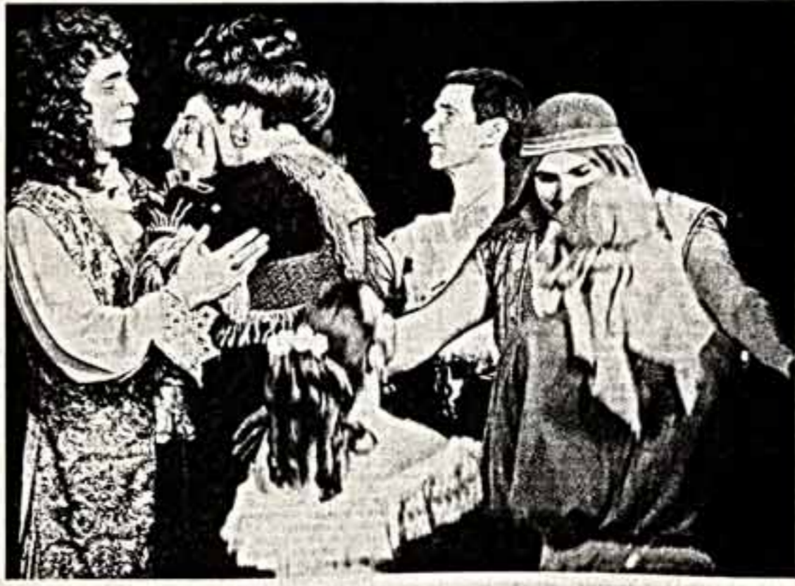
Сцена из спектакля «Полужный Журден» М. Булгакова. (Театр-студия под руководством О. Табакова на ул. Чапаева.)

Первая студентка. Я хотела пойти к Ефремову. Думала, он расскажет мне о разрыве с Олегом Табаковым. Говорят, они были в ссоре. А теперь — снова друзья.