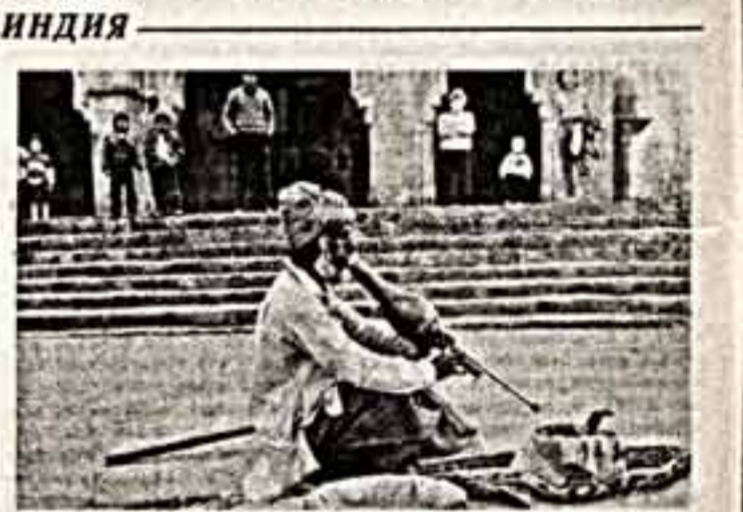
«Дети. С большой интересом местные и иностранные туристы наблюдают за выведением детей, демонстрирующими свое искусство в одной из деревень индийских штатов. Правда, они предпочитают это делать на расстоянии...»