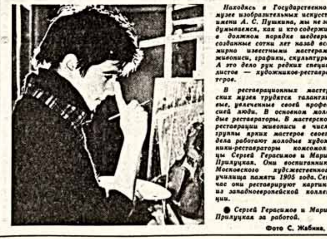
Находится в Государственном музее изобразительных искусств имени А. С. Пушкина, мы не задумывались, как и кто содержит в должном порядке шедевры, созданные сотни лет назад всемирно известными мастерами живописи, графики, скульптуры. А это дело рук редких специалистов — художников-реставраторов.