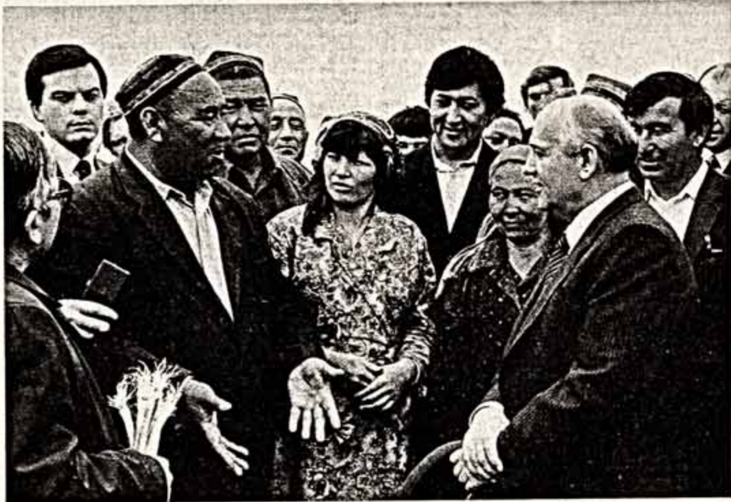
Генеральный секретарь ЦК КПСС М. С. Горбачев во время беседы с работниками колхоза имени Карла Маркса.