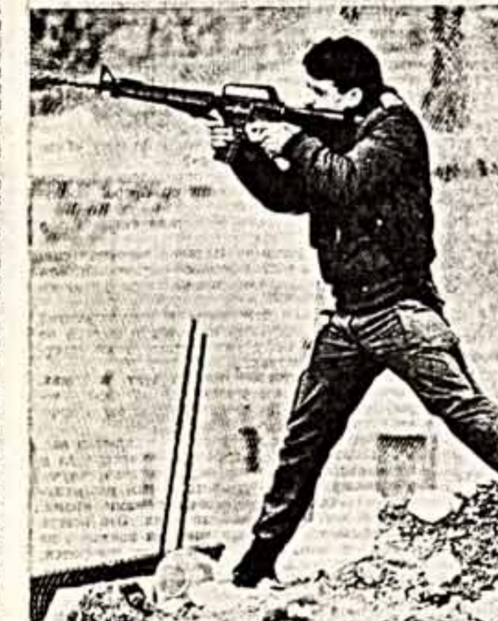
Дети, родившиеся на оккупированных Израилем арабских землях, не по-детски близки к смерти. Слово, все то, что казалось бы, по общему мнению, должно принадлежать детям, а не обычной детской теме «детство». Но на игра и массовое участие юных палестинцев в народном восстании своего народа, вот уже четыре месяца на захваченном на Западной береговой реке Иордан и в секторе Газа...