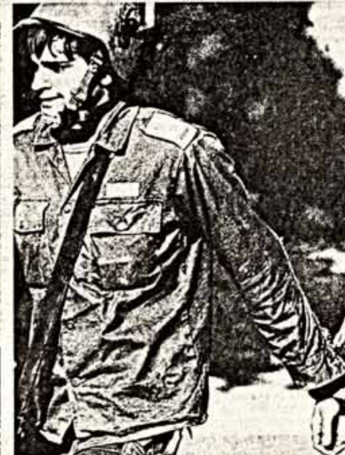
Вступая в столкновения с израильскими солдатами на измученной улице, слова «Родина, свобода, Палестина» звучат для них призывом к борьбе, против которой бесчисленные танки и автоматы, ракеты и торпеды окупателей...