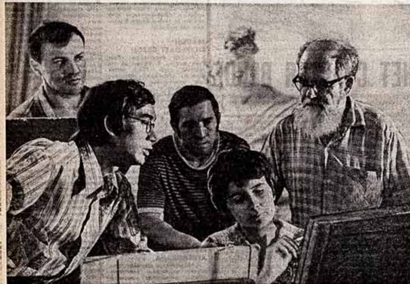
ЗАВОДСКОЙ ИЗОСТУДИИ - ЧЕТВЕРТЬ ВЕКА