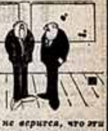
— Даже не верится, что эти картины мои! Нарисовал один и тот же художник!