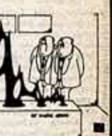
Подумать только, из-за подобной особы могла погибнуть великая Троя! (Полоски на postage stamp скульптуры: «Елена Прекрасная».)

И эта «творческая абстракционистов» всего лишь типичный пример аноромально глубокомысленного блефа, за него хорошо платят. За то прежде всего, что он позволяет в какой-то мере отвлечь внимание населения от волнующих его жизненных проблем. Платят и тут же подвергают осуждению, как это сделал, в частности, широко распространенный западногерманский журнал «Вулге» в опубликованной им серии карикатур и подписей к ним.