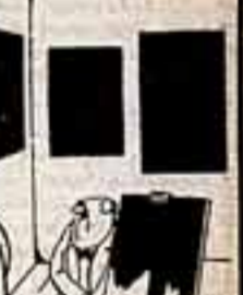
— Это мой новый шедевр. Правда, еще не окончательный.