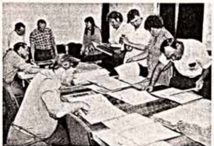
В конце прошлого года образовалось Московское городское объединение архивов — первое в стране. Его составили три центральных госархива столицы, научно-справочная библиотека и производственные службы. Сегодня в объединении «Мосгорархив» хранится свыше четырех миллионов дел, многие из которых являются национальным достоянием, и свыше 50 тысяч уникальных книг.