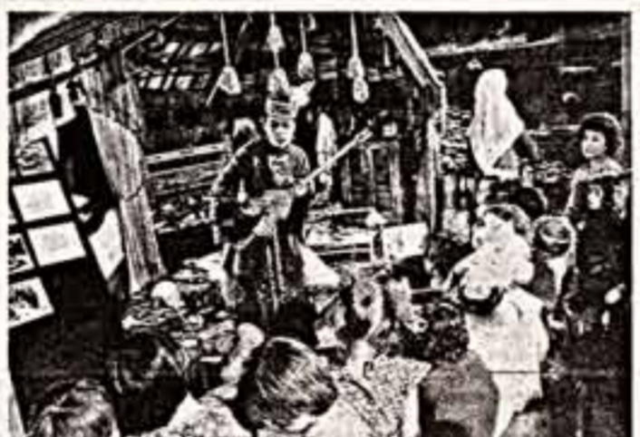
С недавних пор зачастила в Усть-Каменогорский этнографический музей целыми группами детсадовская ребятня. Это повышает интерес обучающихся просто: для малышей здесь проводится специальный цикл «Сказочный понедельник».