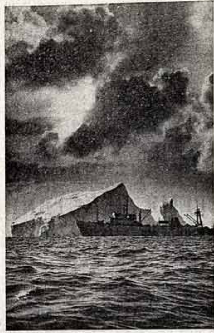
М. СТЕШЕНКО. «Вальс»