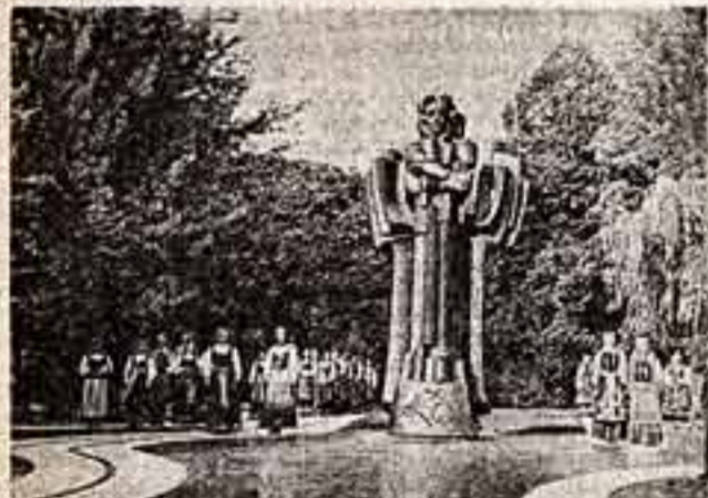
Памятник М. К. Чорленису в Друскининкай.