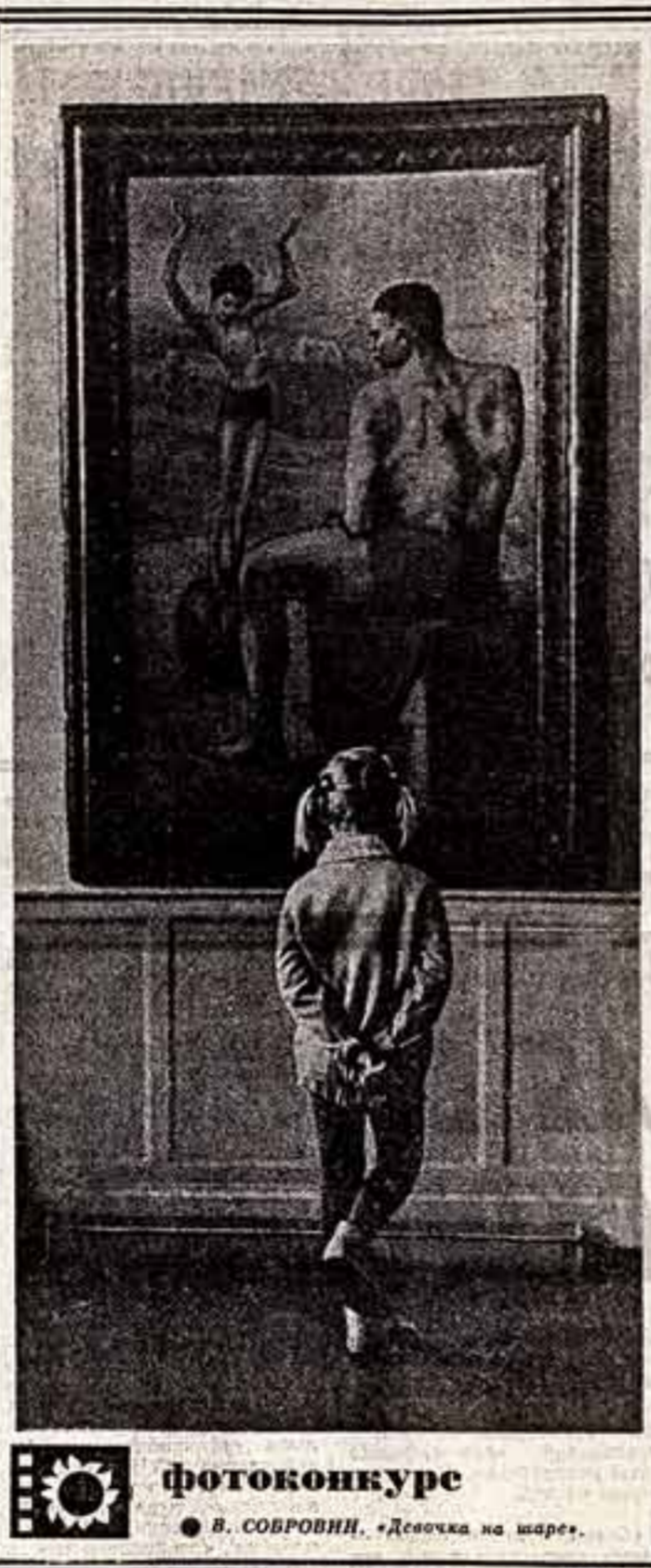
В. СОВРОВНИ. «Девочка на шаре».