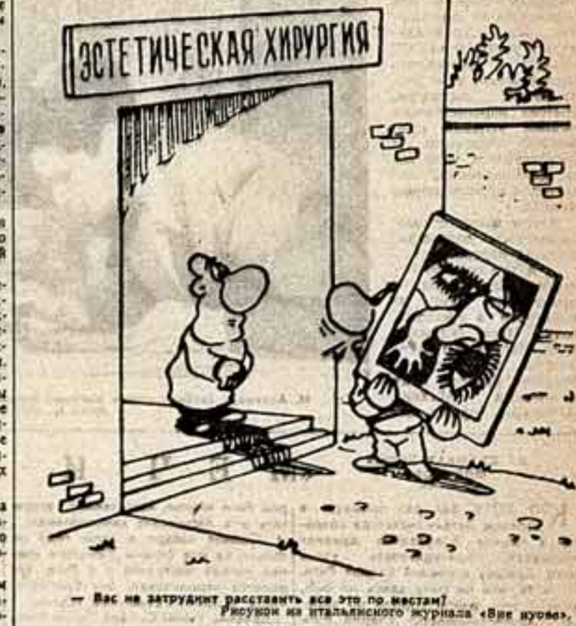
Вас не затруднит расставить все это по местам? Рисуют из итальянского журнала «Все юное».

В Острове строится крупнейший в Чехословакии дворец культуры. Здесь будет размещен большой концертный зал на 1200 мест, театральный зал на 700 зрителей, кукольный театр на 250 мест. Для детей будет оборудовано несколько комнат для кружковой работы и отдыха.