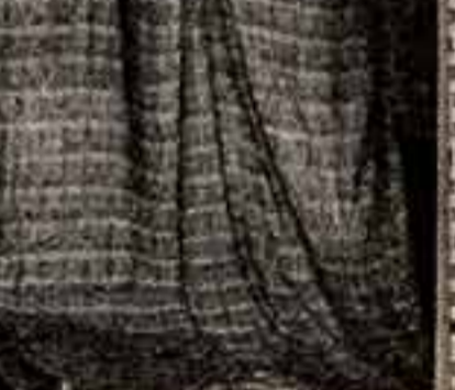
Картина Ямамото Огуну.

Картина Ямамото Огуну была подарена на открывающейся в музее выставке живописи, графики, скульптуры и прикладного искусства Японии XII-XX вв.