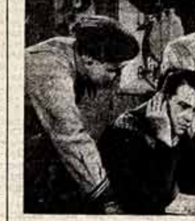
Кадр из фильма «Песнь матросов».

Будет надеяться, что Московский фестиваль станет традиционным и послужит утверждению принципов высокого, подлинно демократического и человеческого искусства.