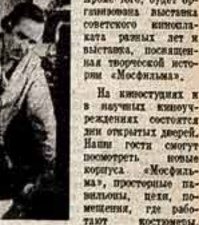
Кадр из фильма «Песнь матросов».

В этом году отмечается сороклетие Ленинского декрета о национализации кинематографии. История нашего кино тесно связана с историей нашего народа, историей великой борьбы, вели-