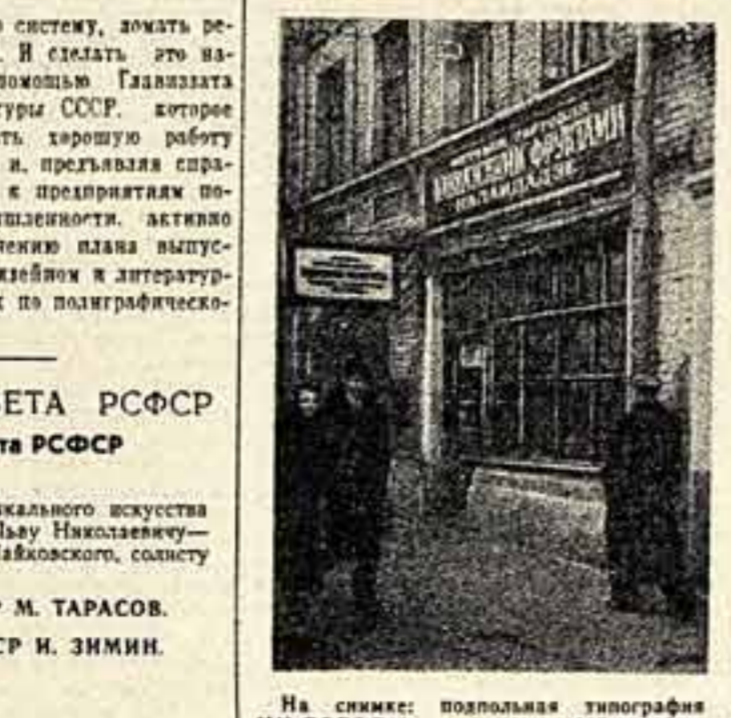
На снимке: заполненная типография ЦК РСДРП (Большевиков) 1905—1906 гг.