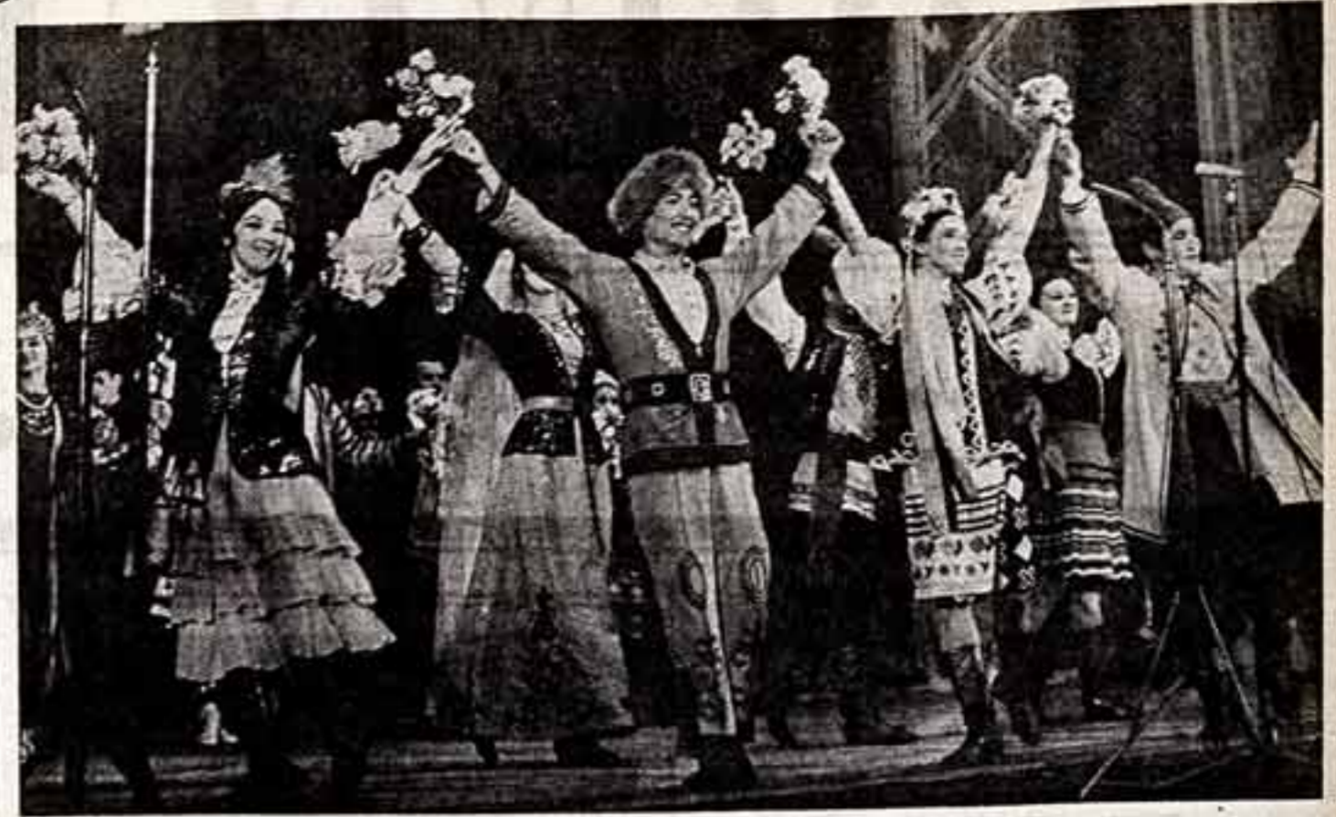
Тело встретила якутская эстрада последние солдаты Башкирии — участником Дней литературы и искусства.