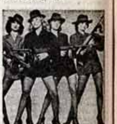
Резня в день святого Валентина столярки пополнили коллектив бригады...