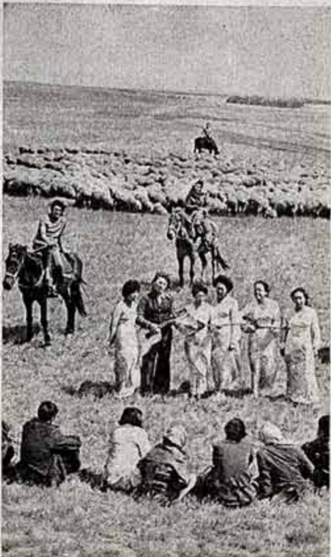
Артисты бригады «Маджест» Кокчетавской области — частый гость у механизаторов и животноводов Казахстана. В бригадах, на полях и в фермах звучат народные песни и песни советских композиторов, исполняются национальные танцы. В период летних работ самодеятельные артисты выехали более двух десятков концертов.

Артисты бригады «Выступают» перед животноводами комсомольско-молодежной совхозной бригады «Дикая» («Белая береза»).