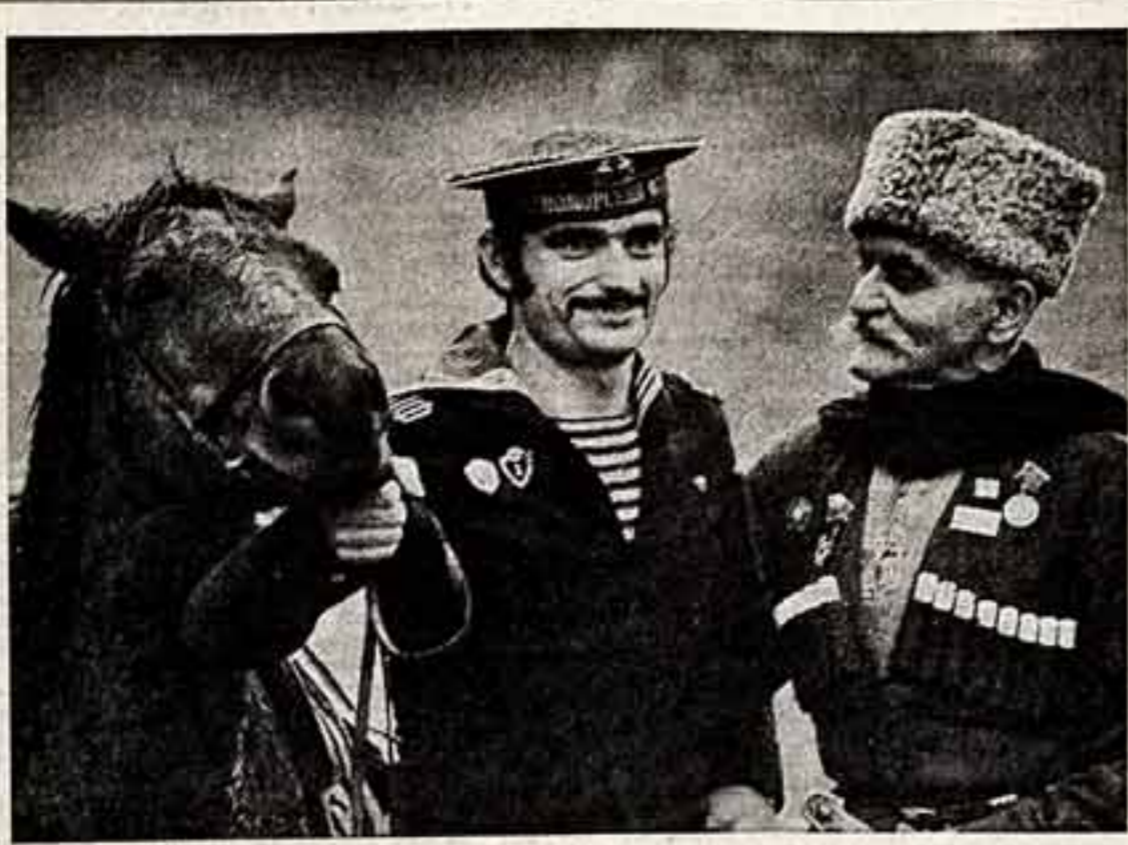
ФОТОКОНКУРС ● Р. ЗВЯГЕЛЬСКИЙ. «Смысл вернулся...»

заведующий Приволжским районым отделом народного образования, депутат районного Совета народных депутатов. Ивановская область.