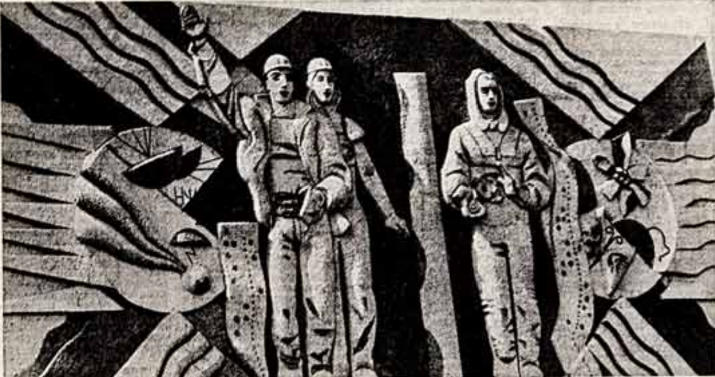
Недавно рабочий поселок строителей и эксплуатационников Курской атомной электростанции Курчатова стал городом. Два больших и красивых город, где живут рабочие, инженеры, ученые. Еще недавно здесь были пустыри, теперь раскинулись проспекты и парки.