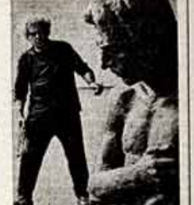
Народный художник СССР Николай Никогозов создавал скульптурный памятник армянскому советскому поэту и общественному деятелю В. Терьяну (В. С. Тер-Горевскому).