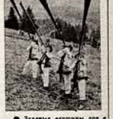
Зеленые вершины гор в Сколковской район Льюсовской области часто буреют раскатыми ветрами, которые срывают с вершин камни. Ветер срывает с вершин камни. Ветер срывает с вершин камни.