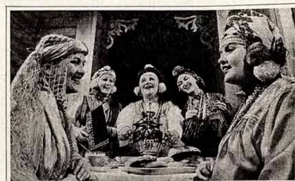
Многоголосая история, быт сибиряков оживает в выступлениях фольклорного ансамбля «Песнопорки» Варнаулского музыкального училища. Название для своего коллектива выбрали сами участники, соединив в одном слове два: песня и хор. Песни обрядные, ритуальные, в основном соответствующие специально подобранные местным. Историко-этнографическое искусство многоголосия Сибирь учащими ансамблем, бывав в многочисленных экспедициях, собирает по «крупицам», «Песнопорки» — познали менталь Варнаул, Новосибирск, других сибирских городов, многоголосия с самобытным народным искусством.