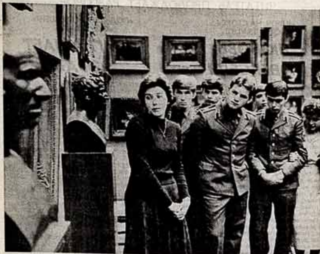
С. ГРИЗЕВ. В картинной галерее.