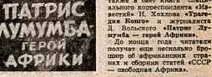
До июня года читатель получит еще несколько брошюр об африканских странах...