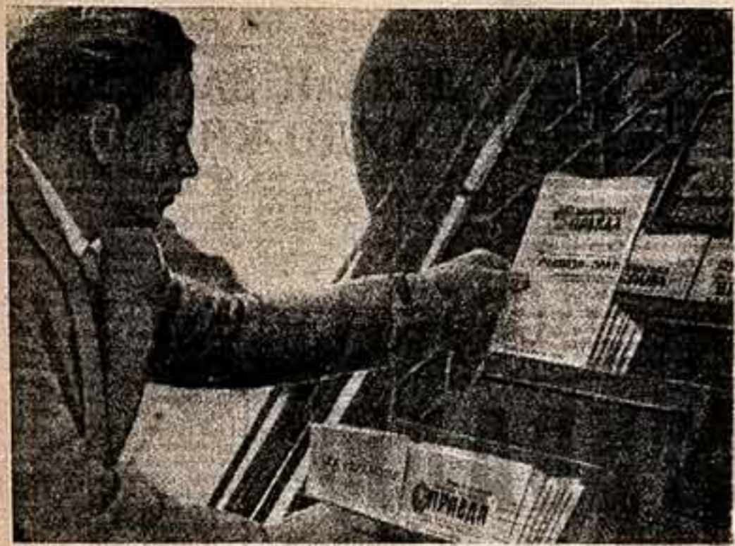
Трамвай, автобус, троллейбус без монитора, магазин без продавца, киоск без кассира, киоск без кассира, театры и кинотеатры без контролера, библиотеки без библиотечаров...