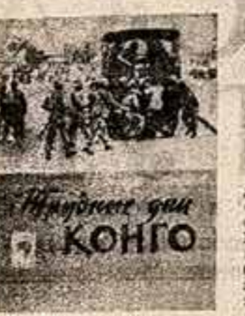
Убийца премьер-министра законного правительства Конго Патриса Лумумбы...