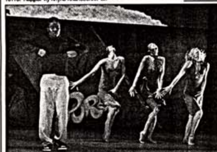
Сцена из спектакля "Доброе утро, мистер Гершвин!"