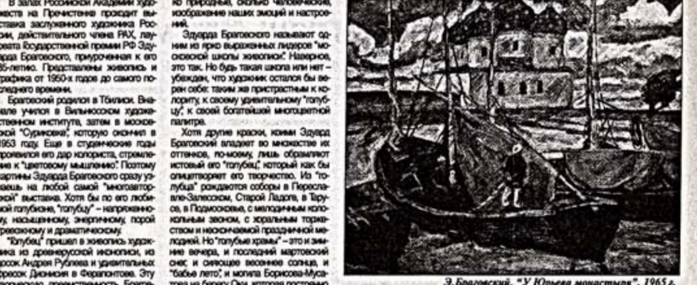
Э. Браговский. "У Юрьева монастыря". 1965 г.

В залах Российской Академии художеств на Пречистенке проходит выставка заслуженного художника России, действительного члена РАХ, лауреата Государственной премии РФ Эдуарда Браговского.