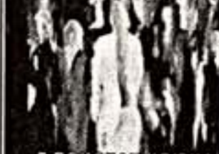
В ПОИСКАХ КЛЮЧА К БЕССМЕРТИЮ

Зекерова Л. "В поисках ключа к бессмертию". Рязань: "Старт", 2008.