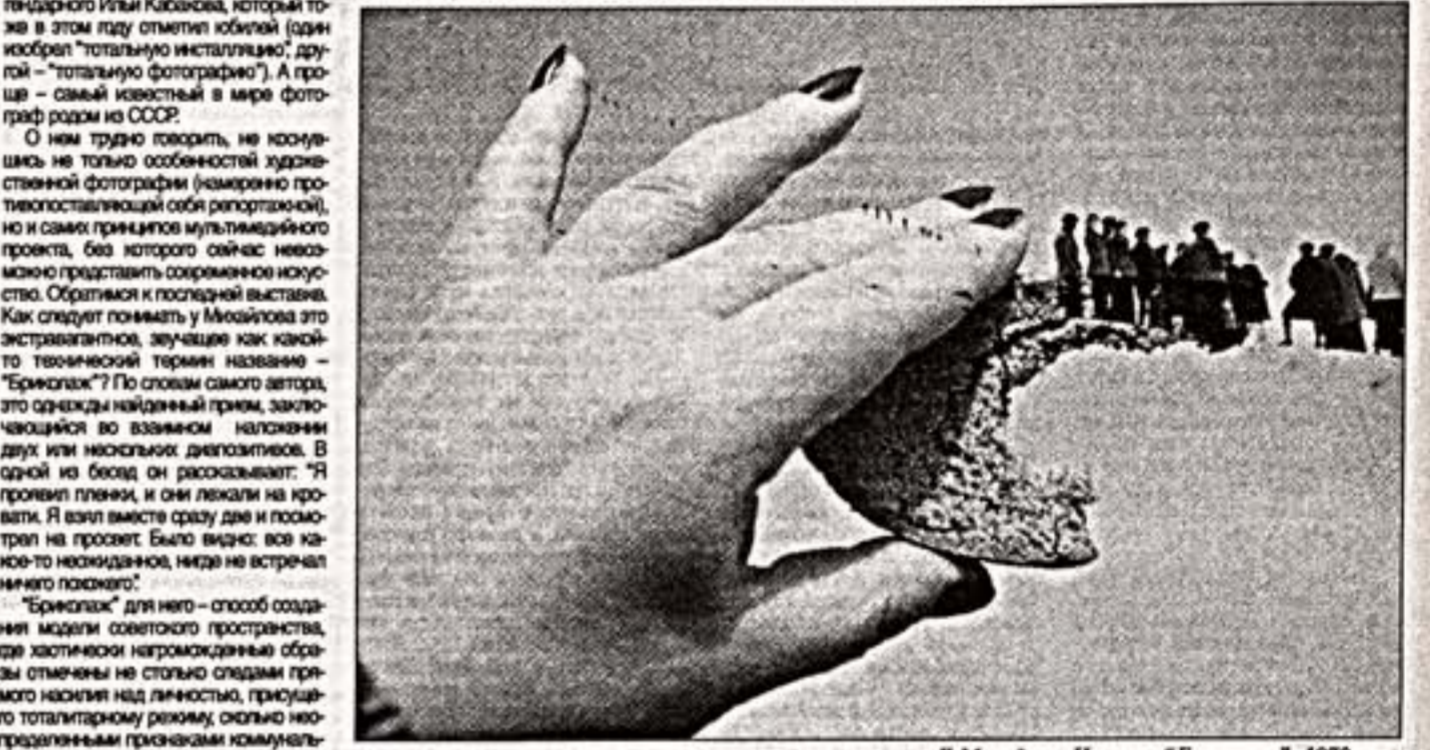
Б. Михайлов. Из серии "Бриколаж". 1970-е гг.

Встречает зрителя большой триптих "Карусель" (1990) — эскиз ко всей экспозиции, хитовая картина творчества Калинина.