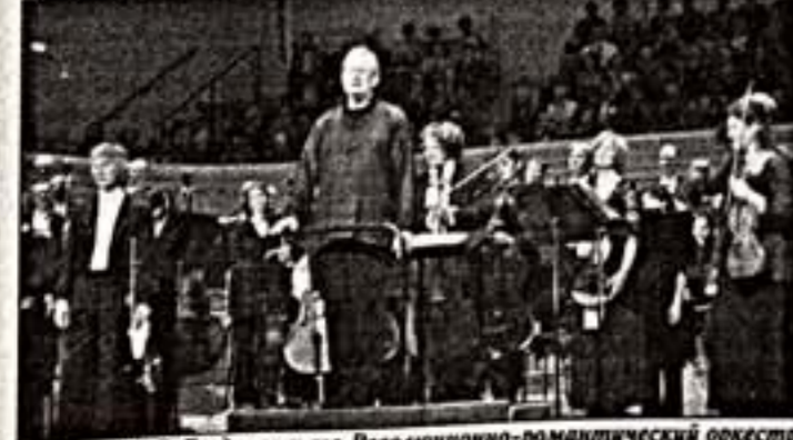
Д.Э.Гардинер и его Революционно-романтический оркестр