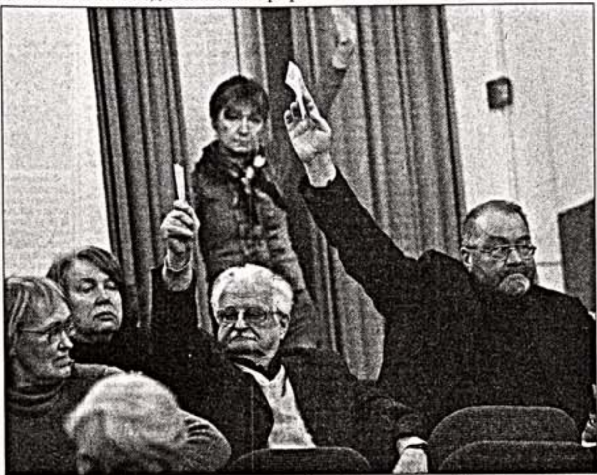
Слева: М. Пореченков. Справа: "Голосуй, а то проиграешь!"