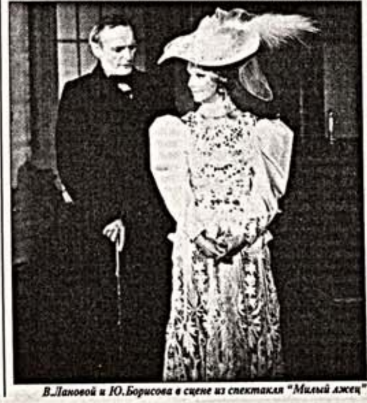
В.Лановой и Ю.Борисова в сцене из спектакля "Милый лжец"