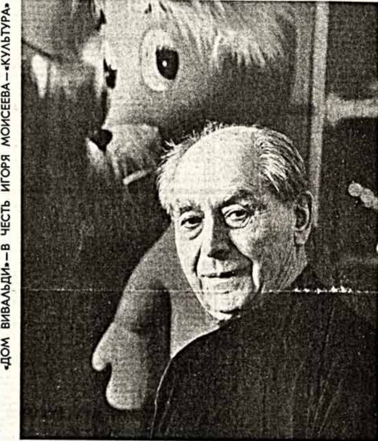
«ДОМ ВИВАЛЬДИ» — В ЧЕСТЬ ИГОРЯ МОЙСЕВА — «КУЛЬТУРА»

О нем знают все. Но по-настоящему его знают единицы. Это противоречие рождено им самим; удивляющий ясностью и открытостью своего искусства — вот оно, на его ладошке! — он той же рукой возводит невидимое прелатствие между собой и окружающими. «Художник должен интересоваться обществом лишь в тех пределах, в каких он нужен обществу» — его слова. Он остается загадкой при том, что очевидно — это сильная, властная личность, сумевшая сохранить себя в катаклизмах эпохи. Это интеллигент, не утративший драгоценной способности к саморазвитию. Это художник с неиссякаемой фантазией и сумасшедшей работоспособностью, проживший бурную, богатую приключениями жизнь и в восемьдесят восемь не потерявший в ней вкуса... Игорь Моисеев. Новый герой приближающегося (открытие через три дня) Фестиваля музыки и танца, проводимого творческим объединением «Дом Вивальди».