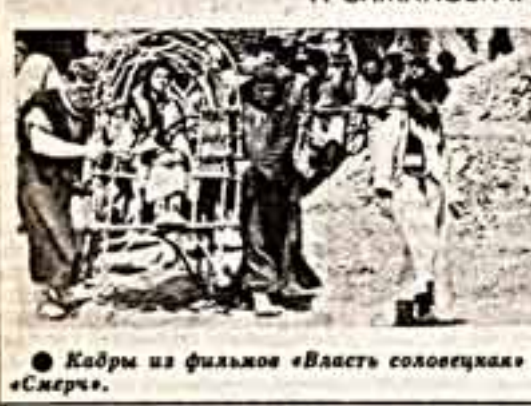
Кадры из фильмов «Власть соловцев» и «Смерть»