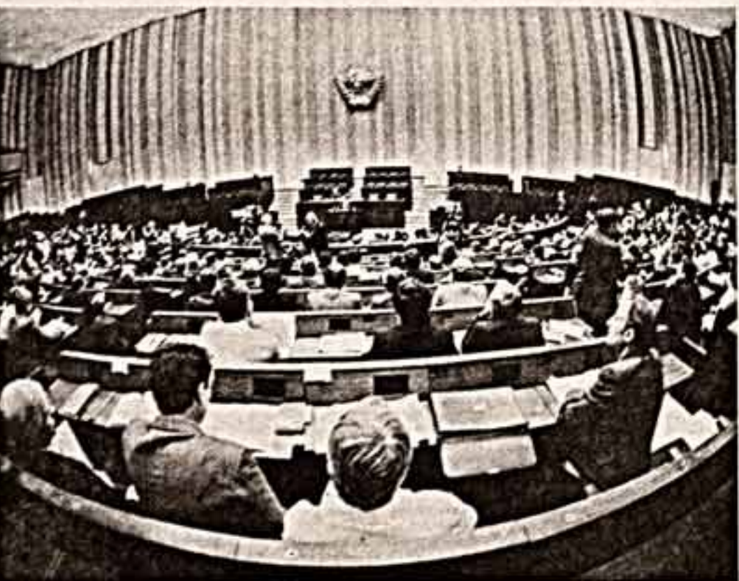
Москва. Первое заседание Совета Союза Верховного Совета СССР нового состава.