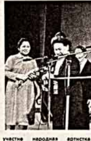
участие народная артистка СССР Р. Багланова, народная артистка Казахской ССР Ш. Живукулова и многие другие мастера национального искусства, отметили в Алма-Ате это радостное событие.

боротерно, стартовую площадку молодых талантов. Нужны поиски, эксперимент, новые сценические решения. Мы намерены пригласить под свою крышу интересные коллективы из