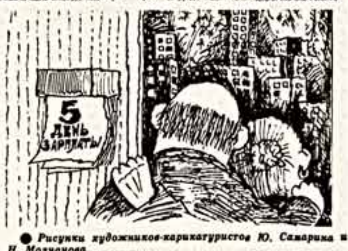
Рисунки художников-карикатуристов Ю. Саварина и Н. Молчанова.