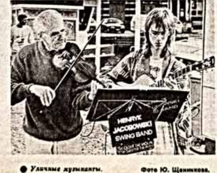
Уличные музыканты. Фото Ю. Щенникова.