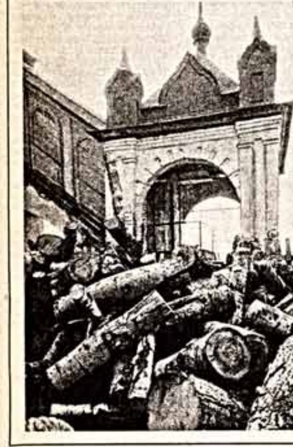
Его основали на правом берегу Волги, прославившись в 1238 году. С тех пор в нем жили князья и бояре. В 1780 году в нем жили декабристы. В 1917 году в нем жили большевики. В 1941 году в нем жили партизаны. В 1945 году в нем жили солдаты. В 1946 году в нем жили офицеры. В 1947 году в нем жили генералы. В 1948 году в нем жили адмиралы. В 1949 году в нем жили маршалы. В 1950 году в нем жили герои. В 1951 году в нем жили герои. В 1952 году в нем жили герои. В 1953 году в нем жили герои. В 1954 году в нем жили герои. В 1955 году в нем жили герои. В 1956 году в нем жили герои. В 1957 году в нем жили герои. В 1958 году в нем жили герои. В 1959 году в нем жили герои. В 1960 году в нем жили герои. В 1961 году в нем жили герои. В 1962 году в нем жили герои. В 1963 году в нем жили герои. В 1964 году в нем жили герои. В 1965 году в нем жили герои. В 1966 году в нем жили герои. В 1967 году в нем жили герои. В 1968 году в нем жили герои. В 1969 году в нем жили герои. В 1970 году в нем жили герои. В 1971 году в нем жили герои. В 1972 году в нем жили герои. В 1973 году в нем жили герои. В 1974 году в нем жили герои. В 1975 году в нем жили герои. В 1976 году в нем жили герои. В 1977 году в нем жили герои. В 1978 году в нем жили герои. В 1979 году в нем жили герои. В 1980 году в нем жили герои. В 1981 году в нем жили герои. В 1982 году в нем жили герои. В 1983 году в нем жили герои. В 1984 году в нем жили герои. В 1985 году в нем жили герои. В 1986 году в нем жили герои. В 1987 году в нем жили герои. В 1988 году в нем жили герои. В 1989 году в нем жили герои. В 1990 году в нем жили герои. В 1991 году в нем жили герои. В 1992 году в нем жили герои. В 1993 году в нем жили герои. В 1994 году в нем жили герои. В 1995 году в нем жили герои. В 1996 году в нем жили герои. В 1997 году в нем жили герои. В 1998 году в нем жили герои. В 1999 году в нем жили герои. В 2000 году в нем жили герои. В 2001 году в нем жили герои. В 2002 году в нем жили герои. В 2003 году в нем жили герои. В 2004 году в нем жили герои. В 2005 году в нем жили герои. В 2006 году в нем жили герои. В 2007 году в нем жили герои. В 2008 году в нем жили герои. В 2009 году в нем жили герои. В 2010 году в нем жили герои. В 2011 году в нем жили герои. В 2012 году в нем жили герои. В 2013 году в нем жили герои. В 2014 году в нем жили герои. В 2015 году в нем жили герои. В 2016 году в нем жили герои. В 2017 году в нем жили герои. В 2018 году в нем жили герои. В 2019 году в нем жили герои. В 2020 году в нем жили герои. В 2021 году в нем жили герои. В 2022 году в нем жили герои. В 2023 году в нем жили герои. В 2024 году в нем жили герои. В 2025 году в нем жили герои. В 2026 году в нем жили герои. В 2027 году в нем жили герои. В 2028 году в нем жили герои. В 2029 году в нем жили герои. В 2030 году в нем жили герои. В 2031 году в нем жили герои. В 2032 году в нем жили герои. В 2033 году в нем жили герои. В 2034 году в нем жили герои. В 2035 году в нем жили герои. В 2036 году в нем жили герои. В 2037 году в нем жили герои. В 2038 году в нем жили герои. В 2039 году в нем жили герои. В 2040 году в нем жили герои. В 2041 году в нем жили герои. В 2042 году в нем жили герои. В 2043 году в нем жили герои. В 2044 году в нем жили герои. В 2045 году в нем жили герои. В 2046 году в нем жили герои. В 2047 году в нем жили герои. В 2048 году в нем жили герои. В 2049 году в нем жили герои. В 2050 году в нем жили герои. В 2051 году в нем жили герои. В 2052 году в нем жили герои. В 2053 году в нем жили герои. В 2054 году в нем жили герои. В 2055 году в нем жили герои. В 2056 году в нем жили герои. В 2057 году в нем жили герои. В 2058 году в нем жили герои. В 2059 году в нем жили герои. В 2060 году в нем жили герои. В 2061 году в нем жили герои. В 2062 году в нем жили герои. В 2063 году в нем жили герои. В 2064 году в нем жили герои. В 2065 году в нем жили герои. В 2066 году в нем жили герои. В 2067 году в нем жили герои. В 2068 году в нем жили герои. В 2069 году в нем жили герои. В 2070 году в нем жили герои. В 2071 году в нем жили герои. В 2072 году в нем жили герои. В 2073 году в нем жили герои. В 2074 году в нем жили герои. В 2075 году в нем жили герои. В 2076 году в нем жили герои. В 2077 году в нем жили герои. В 2078 году в нем жили герои. В 2079 году в нем жили герои. В 2080 году в нем жили герои. В 2081 году в нем жили герои. В 2082 году в нем жили герои. В 2083 году в нем жили герои. В 2084 году в нем жили герои. В 2085 году в нем жили герои. В 2086 году в нем жили герои. В 2087 году в нем жили герои. В 2088 году в нем жили герои. В 2089 году в нем жили герои. В 2090 году в нем жили герои. В 2091 году в нем жили герои. В 2092 году в нем жили герои. В 2093 году в нем жили герои. В 2094 году в нем жили герои. В 2095 году в нем жили герои. В 2096 году в нем жили герои. В 2097 году в нем жили герои. В 2098 году в нем жили герои. В 2099 году в нем жили герои. В 2100 году в нем жили герои. В 2101 году в нем жили герои. В 2102 году в нем жили герои. В 2103 году в нем жили герои. В 2104 году в нем жили герои. В 2105 году в нем жили герои. В 2106 году в нем жили герои. В 2107 году в нем жили герои. В 2108 году в нем жили герои. В 2109 году в нем жили герои. В 2110 году в нем жили герои. В 2111 году в нем жили герои. В 2112 году в нем жили герои. В 2113 году в нем жили герои. В 2114 году в нем жили герои. В 2115 году в нем жили герои. В 2116 году в нем жили герои. В 2117 году в нем жили герои. В 2118 году в нем жили герои. В 2119 году в нем жили герои. В 2120 году в нем жили герои. В 2121 году в нем жили герои. В 2122 году в нем жили герои. В 2123 году в нем жили герои. В 2124 году в нем жили герои. В 2125 году в нем жили герои. В 2126 году в нем жили герои. В 2127 году в нем жили герои. В 2128 году в нем жили герои. В 2129 году в нем жили герои. В 2130 году в нем жили герои. В 2131 году в нем жили герои. В 2132 году в нем жили герои. В 2133 году в нем жили герои. В 2134 году в нем жили герои. В 2135 году в нем жили герои. В 2136 году в нем жили герои. В 2137 году в нем жили герои. В 2138 году в нем жили герои. В 2139 году в нем жили герои. В 2140 году в нем жили герои. В 2141 году в нем жили герои. В 2142 году в нем жили герои. В 2143 году в нем жили герои. В 2144 году в нем жили герои. В 2145 году в нем жили герои. В 2146 году в нем жили герои. В 2147 году в нем жили герои. В 2148 году в нем жили герои. В 2149 году в нем жили герои. В 2150 году в нем жили герои. В 2151 году в нем жили герои. В 2152 году в нем жили герои. В 2153 году в нем жили герои. В 2154 году в нем жили герои. В 2155 году в нем жили герои. В 2156 году в нем жили герои. В 2157 году в нем жили герои. В 2158 году в нем жили герои. В 2159 году в нем жили герои. В 2160 году в нем жили герои. В 2161 году в нем жили герои. В 2162 году в нем жили герои. В 2163 году в нем жили герои. В 2164 году в нем жили герои. В 2165 году в нем жили герои. В 2166 году в нем жили герои. В 2167 году в нем жили герои. В 2168 году в нем жили герои. В 2169 году в нем жили герои. В 2170 году в нем жили герои. В 2171 году в нем жили герои. В 2172 году в нем жили герои. В 2173 году в нем жили герои. В 2174 году в нем жили герои. В 2175 году в нем жили герои. В 2176 году в нем жили герои. В 2177 году в нем жили герои. В 2178 году в нем жили герои. В 2179 году в нем жили герои. В 2180 году в нем жили герои. В 2181 году в нем жили герои. В 2182 году в нем жили герои. В 2183 году в нем жили герои. В 2184 году в нем жили герои. В 2185 году в нем жили герои. В 2186 году в нем жили герои. В 2187 году в нем жили герои. В 2188 году в нем жили герои. В 2189 году в нем жили герои. В 2190 году в нем жили герои. В 2191 году в нем жили герои. В 2192 году в нем жили герои. В 2193 году в нем жили герои. В 2194 году в нем жили герои. В 2195 году в нем жили герои. В 2196 году в нем жили герои. В 2197 году в нем жили герои. В 2198 году в нем жили герои. В 2199 году в нем жили герои. В 2200 году в нем жили герои. В 2201 году в нем жили герои. В 2202 году в нем жили герои. В 2203 году в нем жили герои. В 2204 году в нем жили герои. В 2205 году в нем жили герои. В 2206 году в нем жили герои. В 2207 году в нем жили герои. В 2208 году в нем жили герои. В 2209 году в нем жили герои. В 2210 году в нем жили герои. В 2211 году в нем жили герои. В 2212 году в нем жили герои. В 2213 году в нем жили герои. В 2214 году в нем жили герои. В 2215 году в нем жили герои. В 2216 году в нем жили герои. В 2217 году в нем жили герои. В 2218 году в нем жили герои. В 2219 году в нем жили герои. В 2220 году в нем жили герои. В 2221 году в нем жили герои. В 2222 году в нем жили герои. В 2223 году в нем жили герои. В 2224 году в нем жили герои. В 2225 году в нем жили герои. В 2226 году в нем жили герои. В 2227 году в нем жили герои. В 2228 году в нем жили герои. В 2229 году в нем жили герои. В 2230 году в нем жили герои. В 2231 году в нем жили герои. В 2232 году в нем жили герои. В 2233 году в нем жили герои. В 2234 году в нем жили герои. В 2235 году в нем жили герои. В 2236 году в нем жили герои. В 2237 году в нем жили герои. В 2238 году в нем жили герои. В 2239 году в нем жили герои. В 2240 году в нем жили герои. В 2241 году в нем жили герои. В 2242 году в нем жили герои. В 2243 году в нем жили герои. В 2244 году в нем жили герои. В 2245 году в нем жили герои. В 2246 году в нем жили герои. В 2247 году в нем жили герои. В 2248 году в нем жили герои. В 2249 году в нем жили герои. В 2250 году в нем жили герои. В 2251 году в нем жили герои. В 2252 году в нем жили герои. В 2253 году в нем жили герои. В 2254 году в нем жили герои. В 2255 году в нем жили герои. В 2256 году в нем жили герои. В 2257 году в нем жили герои. В 2258 году в нем жили герои. В 2259 году в нем жили герои. В 2260 году в нем жили герои. В 2261 году в нем жили герои. В 2262 году в нем жили герои. В 2263 году в нем жили герои. В 2264 году в нем жили герои. В 2265 году в нем жили герои. В 2266 году в нем жили герои. В 2267 году в нем жили герои. В 2268 году в нем жили герои. В 2269 году в нем жили герои. В 2270 году в нем жили герои. В 2271 году в нем жили герои. В 2272 году в нем жили герои. В 2273 году в нем жили герои. В 2274 году в нем жили герои. В 2275 году в нем жили герои. В 2276 году в нем жили герои. В 2277 году в нем жили герои. В 2278 году в нем жили герои. В 2279 году в нем жили герои. В 2280 году в нем жили герои. В 2281 году в нем жили герои. В 2282 году в нем жили герои. В 2283 году в нем жили герои. В 2284 году в нем жили герои. В 2285 году в нем жили герои. В 2286 году в нем жили герои. В 2287 году в нем жили герои. В 2288 году в нем жили герои. В 2289 году в нем жили герои. В 2290 году в нем жили герои. В 2291 году в нем жили герои. В 2292 году в нем жили герои. В 2293 году в нем жили герои. В 2294 году в нем жили герои. В 2295 году в нем жили герои. В 2296 году в нем жили герои. В 2297 году в нем жили герои. В 2298 году в нем жили герои. В 2299 году в нем жили герои. В 2300 году в нем жили герои. В 2301 году в нем жили герои. В 2302 году в нем жили герои. В 2303 году в нем жили герои. В 2304 году в нем жили герои. В 2305 году в нем жили герои. В 2306 году в нем жили герои. В 2307 году в нем жили герои. В 2308 году в нем жили герои. В 2309 году в нем жили герои. В 2310 году в нем жили герои. В 2311 году в нем жили герои. В 2312 году в нем жили герои. В 2313 году в нем жили герои. В 2314 году в нем жили герои. В 2315 году в нем жили герои. В 2316 году в нем жили герои. В 2317 году в нем жили герои. В 2318 году в нем жили герои. В 2319 году в нем жили герои. В 2320 году в нем жили герои. В 2321 году в нем жили герои. В 2322 году в нем жили герои. В 2323 году в нем жили герои. В 2324 году в нем жили герои. В 2325 году в нем жили герои. В 2326 году в нем жили герои. В 2327 году в нем жили герои. В 2328 году в нем жили герои. В 2329 году в нем жили герои. В 2330 году в нем жили герои. В 2331 году в нем жили герои. В 2332 году в нем жили герои. В 2333 году в нем жили герои. В 2334 году в нем жили герои. В 2335 году в нем жили герои. В 2336 году в нем жили герои. В 2337 году в нем жили герои. В 2338 году в нем жили герои. В 2339 году в нем жили герои. В 2340 году в нем жили герои. В 2341 году в нем жили герои. В 2342 году в нем жили герои. В 2343 году в нем жили герои. В 2344 году в нем жили герои. В 2345 году в нем жили герои. В 2346 году в нем жили герои. В 2347 году в нем жили герои. В 2348 году в нем жили герои. В 2349 году в нем жили герои. В 2350 году в нем жили герои. В 2351 году в нем жили герои. В 2352 году в нем жили герои. В 2353 году в нем жили герои. В 2354 году в нем жили герои. В 2355 году в нем жили герои. В 2356 году в нем жили герои. В 2357 году в нем жили герои. В 2358 году в нем жили герои. В 2359 году в нем жили герои. В 2360 году в нем жили герои. В 2361 году в нем жили герои. В 2362 году в нем жили герои. В 2363 году в нем жили герои. В 2364 году в нем жили герои. В 2365 году в нем жили герои. В 2366 году в нем жили герои. В 2367 году в нем жили герои. В 2368 году в нем жили герои. В 2369 году в нем жили герои. В 2370 году в нем жили герои. В 2371 году в нем жили герои. В 2372 году в нем жили герои. В 2373 году в нем жили герои. В 2374 году в нем жили герои. В 2375 году в нем жили герои. В 2376 году в нем жили герои. В 2377 году в нем жили герои. В 2378 году в нем жили герои. В 2379 году в нем жили герои. В 2380 году в нем жили герои. В 2381 году в нем жили герои. В 2382 году в нем жили герои. В 2383 году в нем жили герои. В 2384 году в нем жили герои. В 2385 году в нем жили герои. В 2386 году в нем жили герои. В 2387 году в нем жили герои. В 2388 году в нем жили герои. В 2389 году в нем жили герои. В 2390 году в нем жили герои. В 2391 году в нем жили герои. В 2392 году в нем жили герои. В 2393 году в нем жили герои. В 2394 году в нем жили герои. В 2395 году в нем жили герои. В 2396 году в нем жили герои. В 2397 году в нем жили герои. В 2398 году в нем жили герои. В 2399 году в нем жили герои. В 2400 году в нем жили герои. В 2401 году в нем жили герои. В 2402 году в нем жили герои. В 2403 году в нем жили герои. В 2404 году в нем жили герои. В 2405 году в нем жили герои. В 2406 году в нем жили герои. В 2407 году в нем жили герои. В 2408 году в нем жили герои. В 2409 году в нем жили герои. В 2410 году в нем жили герои. В 2411 году в нем жили герои. В 2412 году в нем жили герои. В 2413 году в нем жили герои. В 2414 году в нем жили герои. В 2415 году в нем жили герои. В 2416 году в нем жили герои. В 2417 году в нем жили герои. В 2418 году в нем жили герои. В 2419 году в нем жили герои. В 2420 году в нем жили герои. В 2421 году в нем жили герои. В 2422 году в нем жили герои. В 2423 году в нем жили герои. В 2424 году в нем жили герои. В 2425 году в нем жили герои. В 2426 году в нем жили герои. В 2427 году в нем жили герои. В 2428 году в нем жили герои. В 2429 году в нем жили герои. В 2430 году в нем жили герои. В 2431 году в нем жили герои. В 2432 году в нем жили герои. В 2433 году в нем жили герои. В 2434 году в нем жили герои. В 2435 году в нем жили герои. В 2436 году в нем жили герои. В 2437 году в нем жили герои. В 2438 году в нем жили герои. В 2439 году в нем жили герои. В 2440 году в нем жили герои. В 2441 году в нем жили герои. В 2442 году в нем жили герои. В 2443 году в нем жили герои. В 2444 году в нем жили герои. В 2445 году в нем жили герои. В 2446 году в нем жили герои. В 2447 году в нем жили герои. В 2448 году в нем жили герои. В 2449 году в нем жили герои. В 2450 году в нем жили герои. В 2451 году в нем жили герои. В 2452 году в нем жили герои. В 2453 году в нем жили герои. В 2454 году в нем жили герои. В 2455 году в нем жили герои. В 2456 году в нем жили герои. В 2457 году в нем жили герои. В 2458 году в нем жили герои. В 2459 году в нем жили герои. В 2460 году в нем жили герои. В 2461 году в нем жили герои. В 2462 году в нем жили герои. В 2463 году в нем жили герои. В 2464 году в нем жили герои. В 2465 году в нем жили герои. В 2466 году в нем жили герои. В 2467 году в нем жили герои. В 2468 году в нем жили герои. В 2469 году в нем жили герои. В 2470 году в нем жили герои. В 2471 году в нем жили герои. В 2472 году в нем жили герои. В 2473 году в нем жили герои. В 2474 году в нем жили герои. В 2475 году в нем жили герои. В 2476 году в нем жили герои. В 2477 году в нем жили герои. В 2478 году в нем жили герои. В 2479 году в нем жили герои. В 2480 году в нем жили герои. В 2481 году в нем жили герои. В 2482 году в нем жили герои. В 2483 году в нем жили герои. В 2484 году в нем жили герои. В 2485 году в нем жили герои. В 2486 году в нем жили герои. В 2487 году в нем жили герои. В 2488 году в нем жили герои. В 2489 году в нем жили герои. В 2490 году в нем жили герои. В 2491 году в нем жили герои. В 2492 году в нем жили герои. В 2493 году в нем жили герои. В 2494 году в нем жили герои. В 2495 году в нем жили герои. В 2496 году в нем жили герои. В 2497 году в нем жили герои. В 2498 году в нем жили герои. В 2499 году в нем жили герои. В 2500 году в нем жили герои. В 2501 году в нем жили герои. В 2502 году в нем жили герои. В 2503 году в нем жили герои. В 2504 году в нем жили герои. В 2505 году в нем жили герои. В 2506 году в нем жили герои. В 2507 году в нем жили герои. В 2508 году в нем жили герои. В 2509 году в нем жили герои. В 2510 году в нем жили герои. В 2511 году в нем жили герои. В 2512 году в нем жили герои. В 2513 году в нем жили герои. В 2514 году в нем жили герои. В 2515 году в нем жили герои. В 2516 году в нем жили герои. В 2517 году в нем жили герои. В 2518 году в нем жили герои. В 2519 году в нем жили герои. В 2520 году в нем жили герои. В 2521 году в нем жили герои. В 2522 году в нем жили герои. В 2523 году в нем жили герои. В 2524 году в нем жили герои. В 2525 году в нем жили герои. В 2526 году в нем жили герои. В 2527 году в нем жили герои. В 2528 году в нем жили герои. В 2529 году в нем жили герои. В 2530 году в нем жили герои. В 2531 году в нем жили герои. В 2532 году в нем жили герои. В 2533 году в нем жили герои. В 2534 году в нем жили герои. В 2535 году в нем жили герои. В 2536 году в нем жили герои. В 2537 году в нем жили герои. В 2538 году в нем жили герои. В 2539 году в нем жили герои. В 2540 году в нем жили герои. В 2541 году в нем жили герои. В 2542 году в нем жили герои. В 2543 году в нем жили герои. В 2544 году в нем жили герои. В 2545 году в нем жили герои. В 2546 году в нем жили герои. В 2547 году в нем жили герои. В 2548 году в нем жили герои. В 2549 году в нем жили герои. В 2550 году в нем жили герои. В 2551 году в нем жили герои. В 2552 году в нем жили герои. В 2553 году в нем жили герои. В 2554 году в нем жили герои. В 2555 году в нем жили герои. В 2556 году в нем жили герои. В 2557 году в нем жили герои. В 2558 году в нем жили герои. В 2559 году в нем жили герои. В 2560 году в нем жили герои. В 2561 году в нем жили герои. В 2562 году в нем жили герои. В 2563 году в нем жили герои. В 2564 году в нем жили герои. В 2565 году в нем жили герои. В 2566 году в нем жили герои. В 2567 году в нем жили герои. В 2568 году в нем жили герои. В 2569 году в нем жили герои. В 2570 году в нем жили герои. В 2571 году в нем жили герои. В 2572 году в нем жили герои. В 2573 году в нем жили герои. В 2574 году в нем жили герои. В 2575 году в нем жили герои. В 2576 году в нем жили герои. В 2577 году в нем жили герои. В 2578 году в нем жили герои. В 2579 году в нем жили герои. В 2580 году в нем жили герои. В 2581 году в нем жили герои. В 2582 году в нем жили герои. В 2583 году в нем жили герои. В 2584 году в нем жили герои. В 2585 году в нем жили герои. В 2586 году в нем жили герои. В 2587 году в нем жили герои. В 2588 году в нем жили герои. В 2589 году в нем жили герои. В 2590 году в нем жили герои. В 2591 году в нем жили герои. В 2592 году в нем жили герои. В 2593 году в нем жили герои. В 2594 году в нем жили герои. В 2595 году в нем жили герои. В 2596 году в нем жили герои. В 2597 году в нем жили герои. В 2598 году в нем жили герои. В 2599 году в нем жили герои. В 2600 году в нем жили герои. В 2601 году в нем жили герои. В 2602 году в нем жили герои. В 2603 году в нем жили герои. В 2604 году в нем жили герои. В 2605 году в нем жили герои. В 2606 году в нем жили герои. В 2607 году в нем жили герои. В 2608 году в нем жили герои. В 2609 году в нем жили герои. В 2610 году в нем жили герои. В 2611 году в нем жили герои. В 2612 году в нем жили герои. В 2613 году в нем жили герои. В 2614