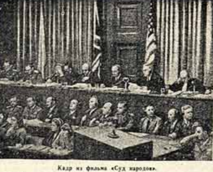
Кадр из фильма „Суд народов“