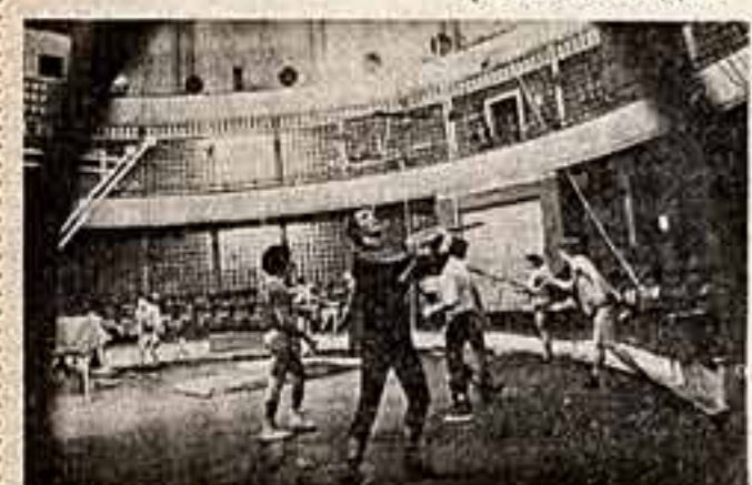
На манеже учебного цирка.