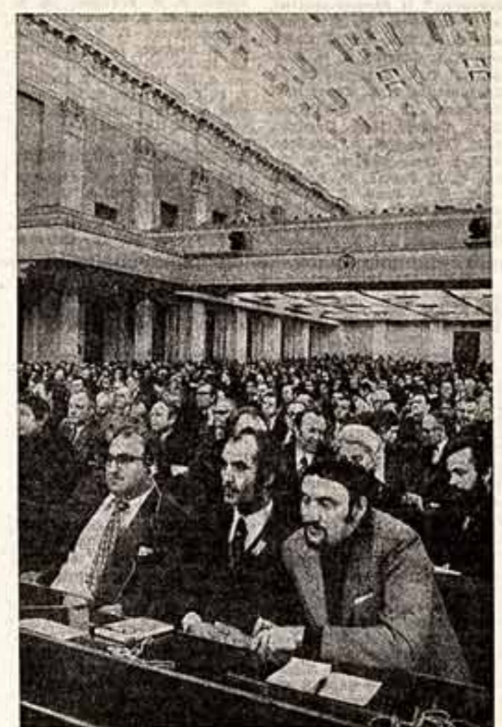
В зале заседаний V съезда художников СССР.