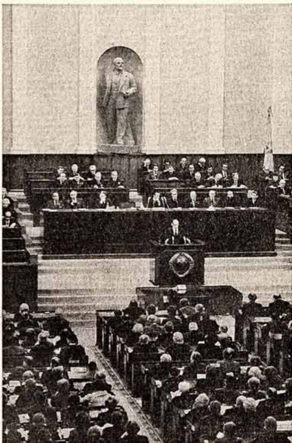
В Большой Кремлевской дворце на V съезде художников СССР.