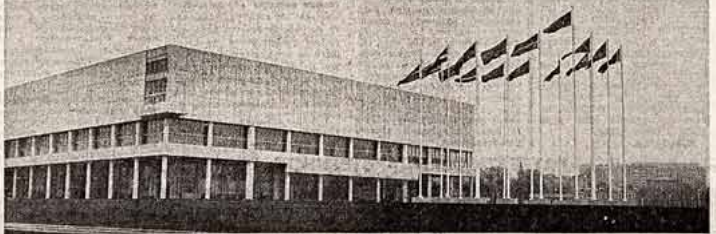
● Новое здание картинной галереи.