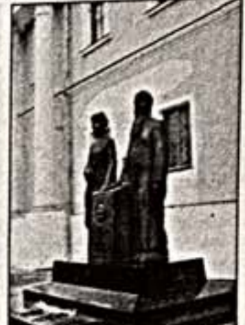
Международный центр Рерихов