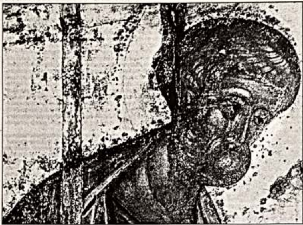
Минкультуры РФ обещает разработать программу по сохранению наследия А.Рублева