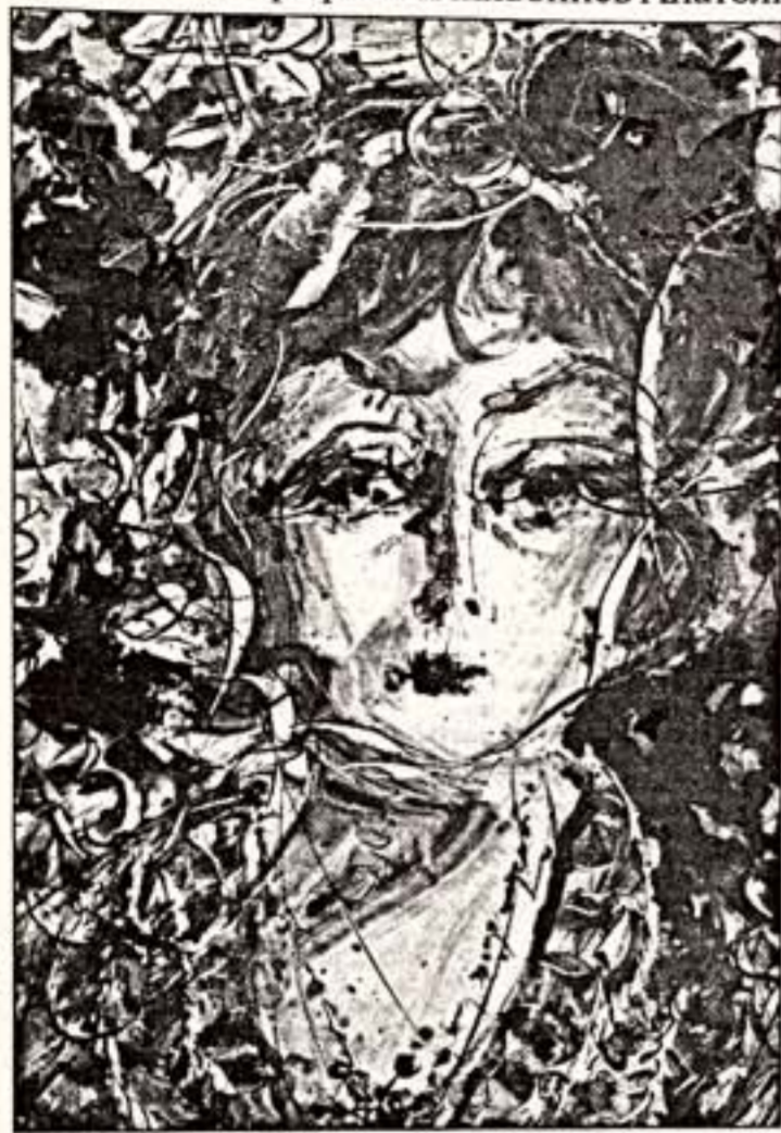
Работа А. Зверева

Графика и живопись Анатолия Зверева в "Доме Нашокина"