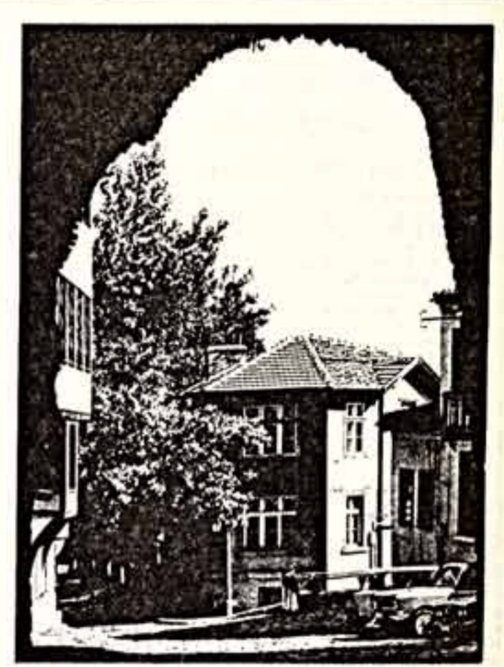
Тихий вечер в Пловдиве.